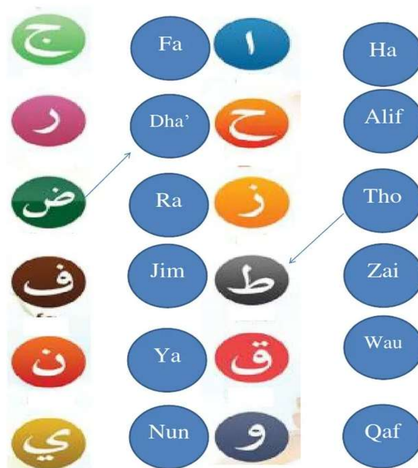
Gambar 4.2. Contoh Soal Menjodohkan Huruf Hijaiyah pada Tahap Evaluasi Pembelajaran di SLB Negeri 2 Banjarmasin

Tahap evaluasi pada dasarnya merupakan tahap untuk mengukur tercapai atau tidaknya tujuan pembelajaran. Namun, dikarenakan kemampuan masing-masing murid di SLB Negeri 2 Banjarmasin berbeda, maka materi pembelajaran yang diberikan pun juga berbeda, sehingga