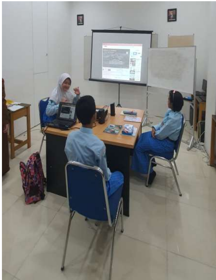
Gambar 4.4. Proses Pembelajaran PAI Berbasis E-Learning Menggunakan Media Proyektor LCD di SLB Harapan Bunda Banjarmasin

Kemudian guru membimbing murid untuk menjawabnya dengan penuh kesabaran. 45