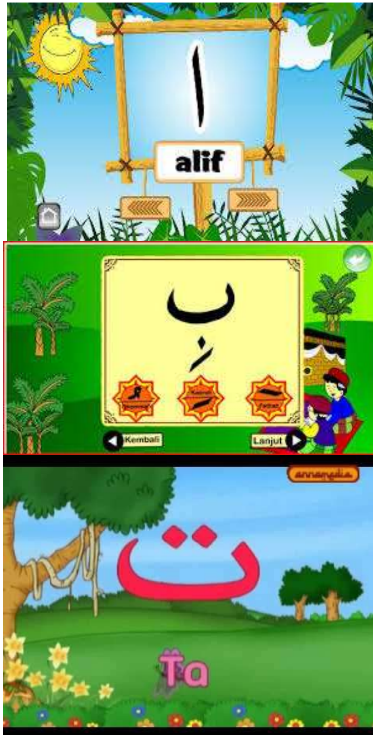
Gambar 4.1. Contoh Slide Power Point yang Digunakan pada Pembelajaran PAI Berbasis E-Learning di SLB Negeri 2 Banjarmasin