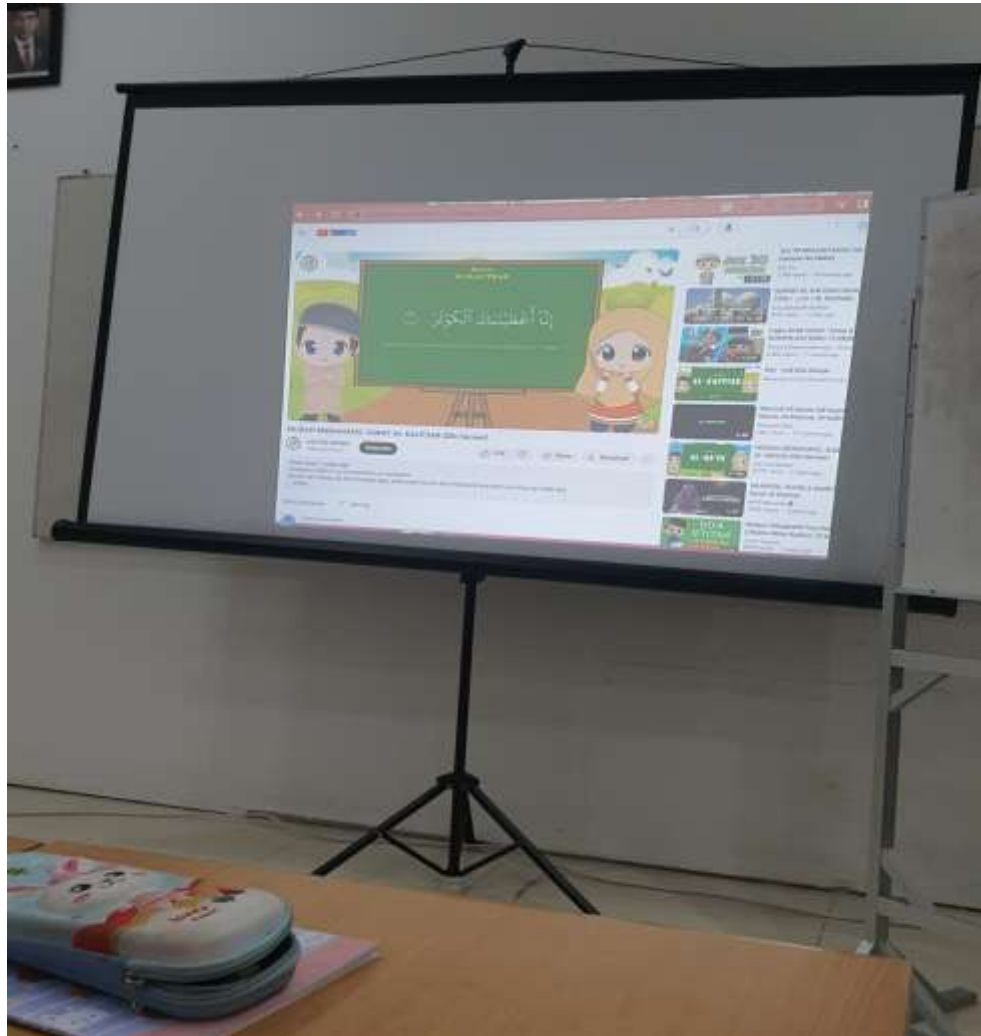
Gambar 4.5. Contoh Video Youtube yang Digunakan dalam Pembelajaran PAI Berbasis E-Learning di SLB Harapan Bunda Banjarmasin

Setelah itu, guru kemudian meminta murid untuk menulis huruf hijaiyah di buku tulisnya. Sama seperti sebelumnya, jika murid belum bisa menulis, maka guru lah yang akan membantu menuliskannya di buku tulis sang murid. Akan tetapi, pada murid yang dirasa sudah cukup mahir, guru hanya membuat garis putus-putus di buku tulis sang murid dan menugaskan murid tersebut untuk menebalkannya. Hal semacam ini