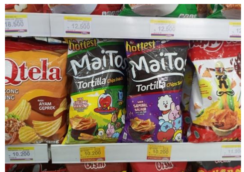
Jajanan Minimarket yang Mengandung unsur KW di Kota Banjarmasin dan Kota Banjarbaru