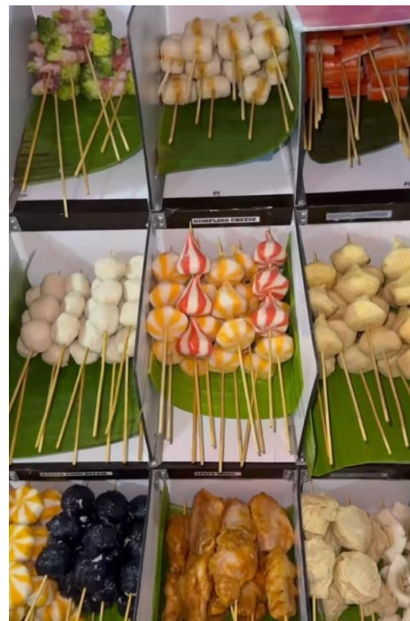
Jajanan Pinggir Jalan Ala Korea