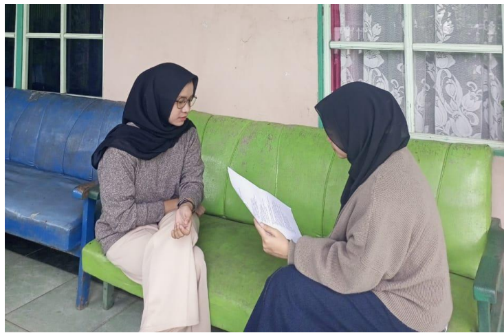
Wawancara dengan penggemar KW di Kota Banjarmasin