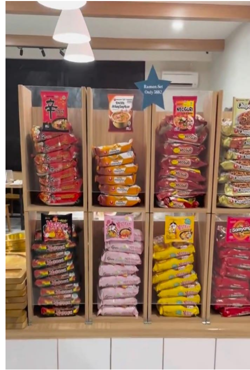
Kedai Mie Instan Korea