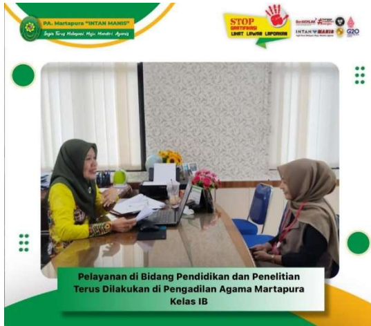
Wawancara dengan Wakil Ketua dan Hakim Pengadilan Agama Martapura