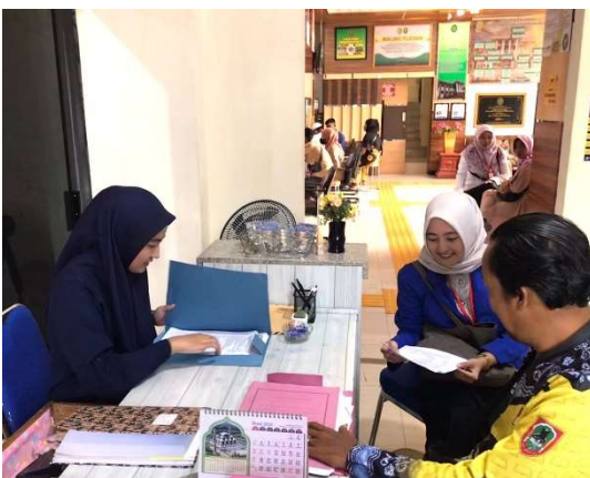
Wawancara dengan Tergugat di Pengadilan Agama Martapura