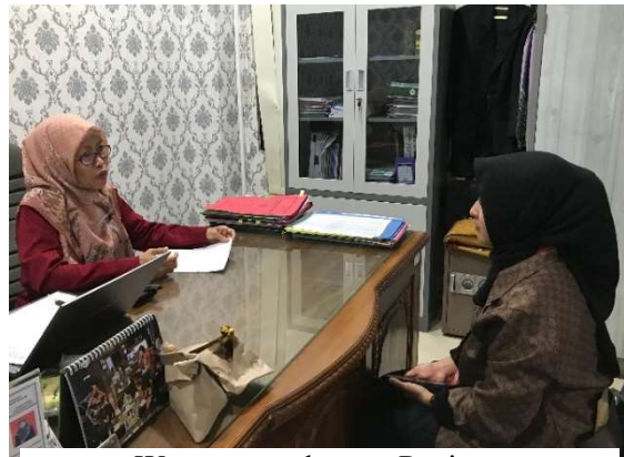
Wawancara dengan Panitera Pengadilan Agama Marapura