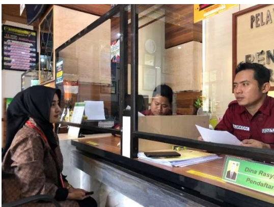
Wawancara dengan Petugas PTSL Pengadilan Agama Marapura