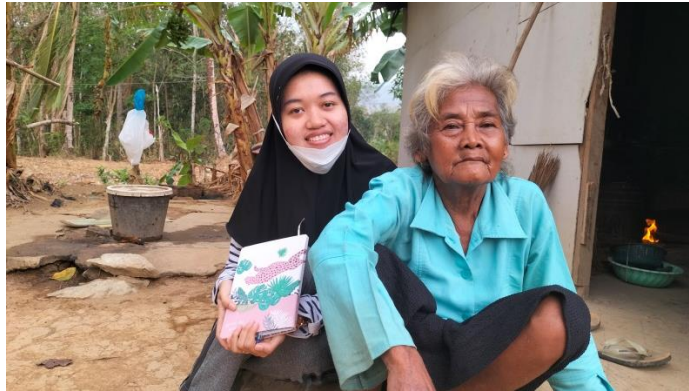
Wawancara dengan Masyarakat Desa