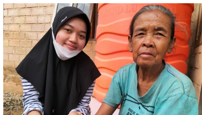
Wawancara dengan Masyarakat Desa