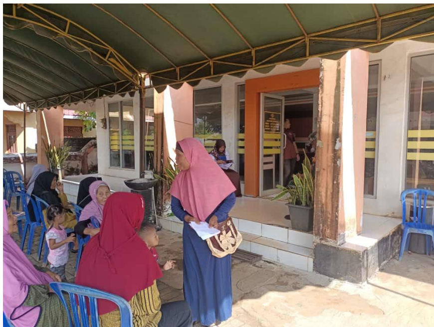
Proses Penyaluran BLT-DD