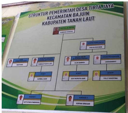
Foto Struktur Pemerintah Desa Tirta Jaya