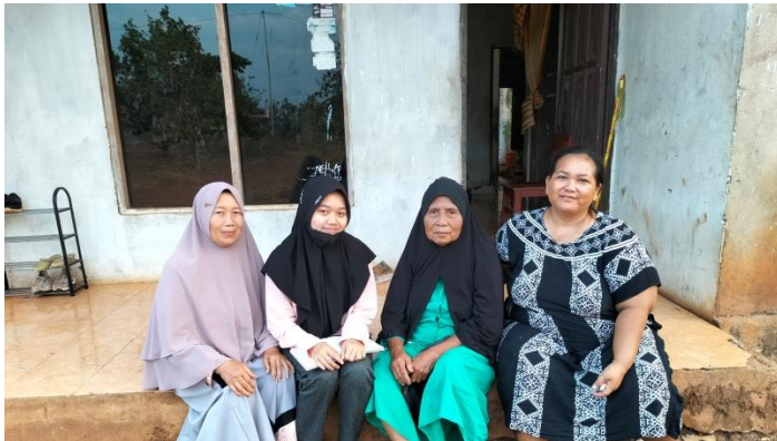
Wawancara dengan Masyarakat Desa