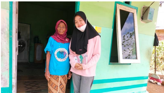
Wawancara dengan Masyarakat Desa