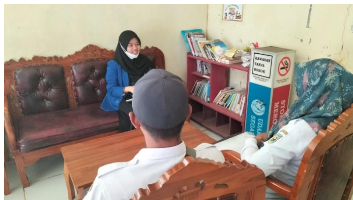
Wawancara dengan Bendahara Desa dan Kasi Pemasarakatan