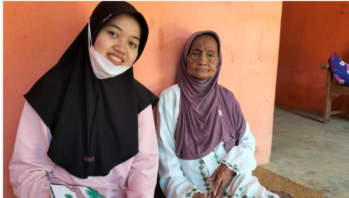
Wawancara dengan Masyarakat Desa