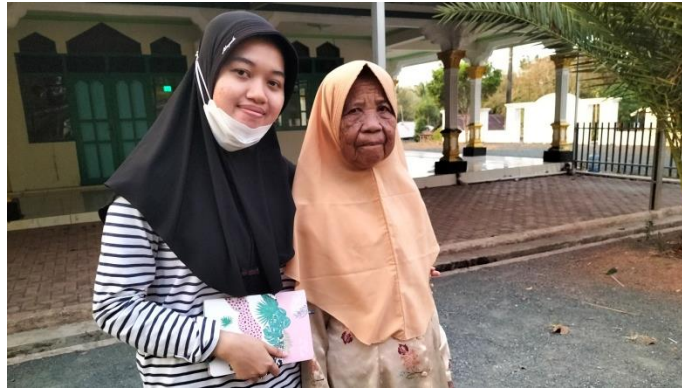
Wawancara dengan Masyarakat Desa