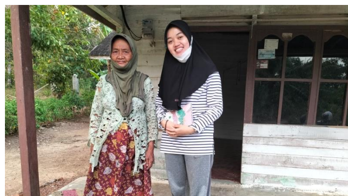
Wawancara dengan Masyarakat Desa