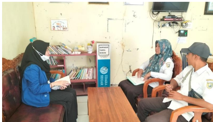
Wawancara dengan Bendahara Desa dan Kasi Pemasarakatan