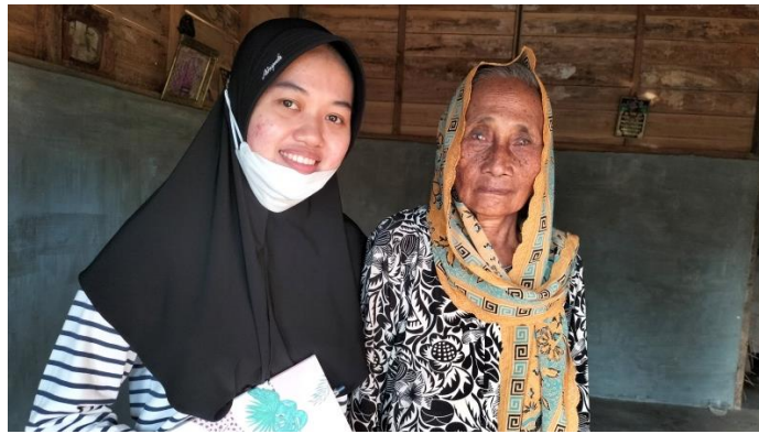
Wawancara dengan Masyarakat Desa