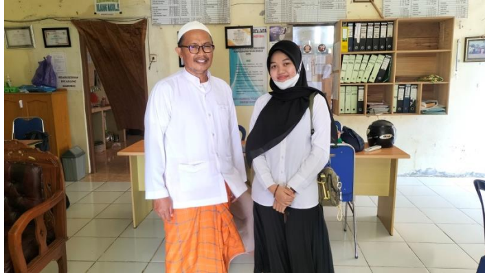
Wawancara dengan Kepala Desa Tirta Jaya