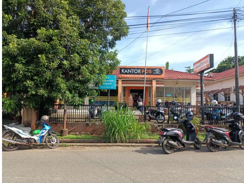
Tempat Pengambilan BLT-DD