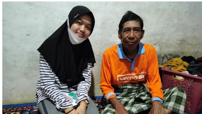
Wawancara dengan Masyarakat Desa