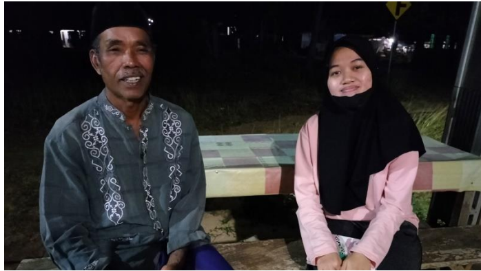
Wawancara dengan Ketua RT