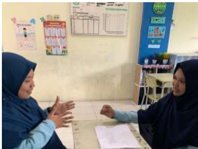
Wawancara dengan guru