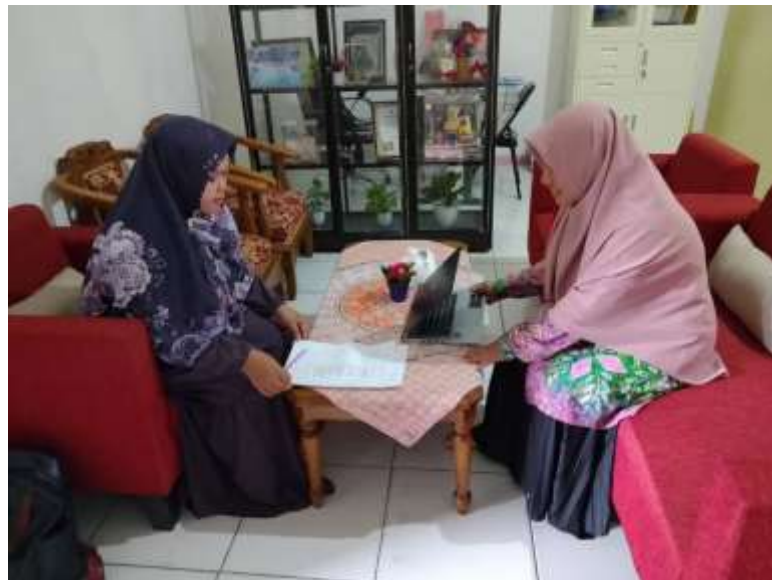
Wawancara dengan kepala sekolah