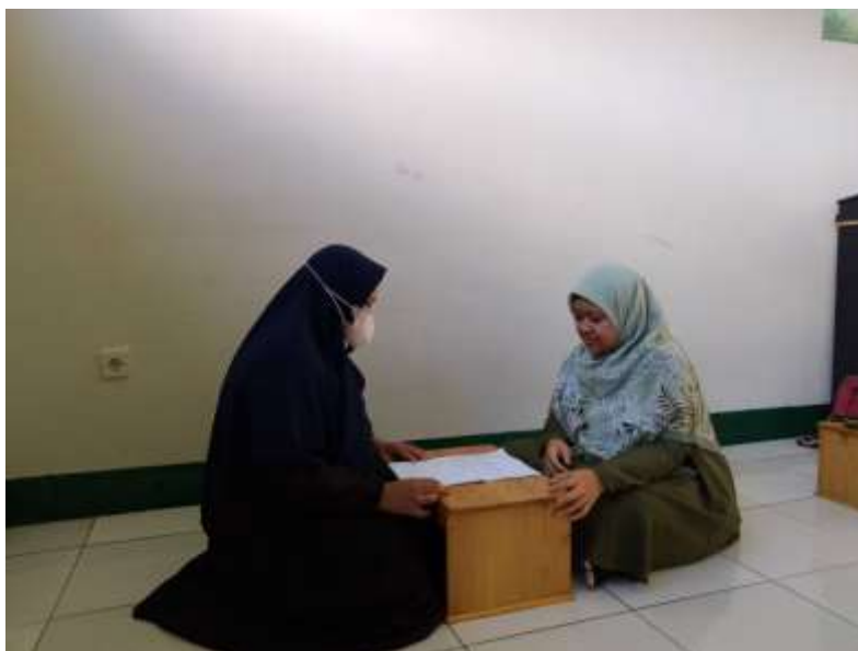
Wawancara dengan guru