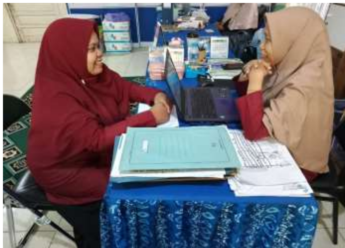
Wawancara dengan wakil kepala sekolah (bidang kurikulum)