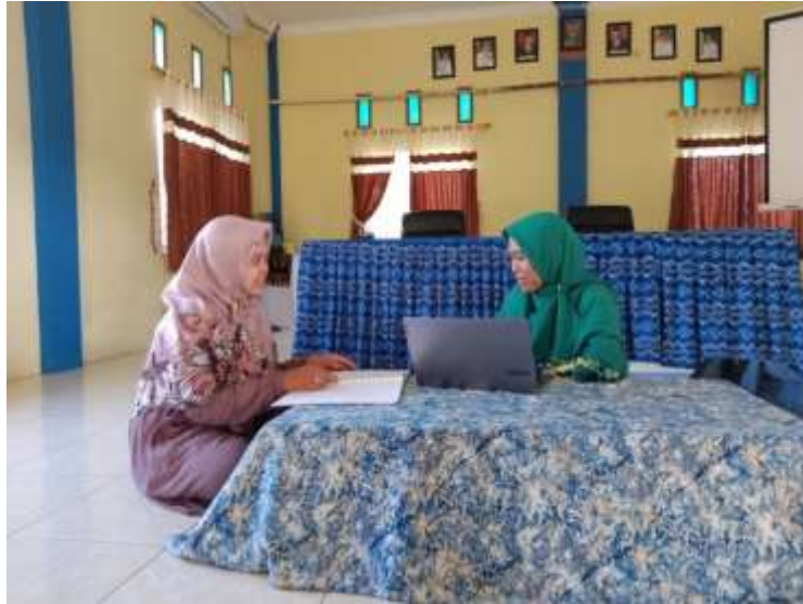
Wawancara dengan kepala sekolah