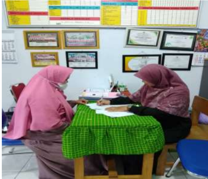
Wawancara dengan guru