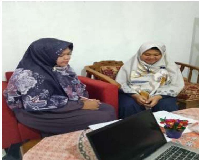
Wawancara dengan wakil kepala sekolah (bidang kurikulum)