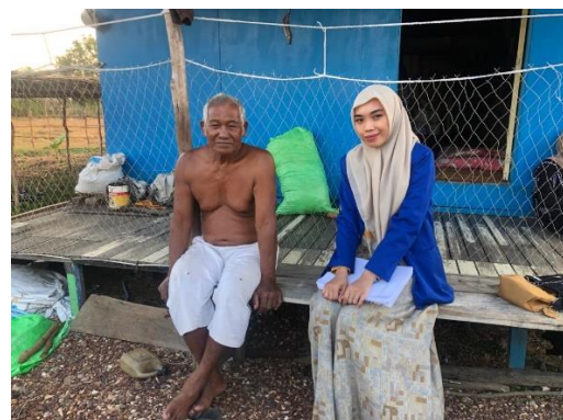
Wawancara dengan B