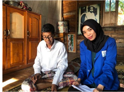
Wawancara dengan AH