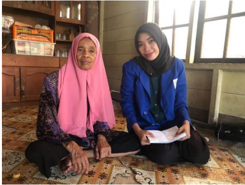
Wawancara dengan M