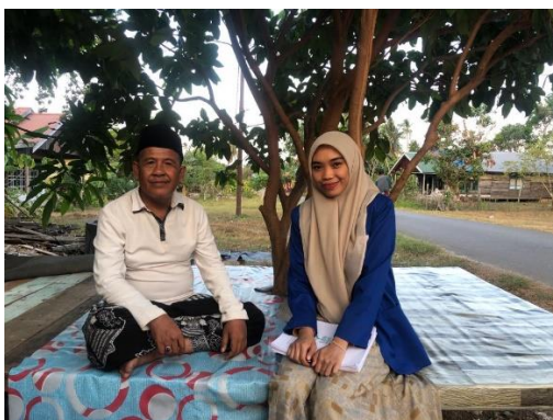
Wawancara dengan IH