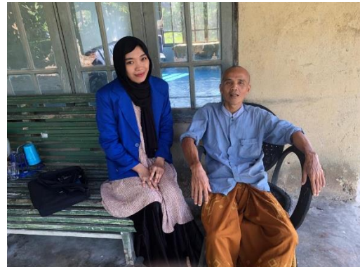
Wawancara dengan AR