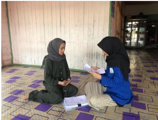
Wawancara dengan ML