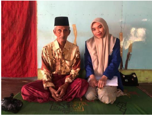
Wawancara dengan T