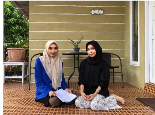
Wawancara dengan SNA