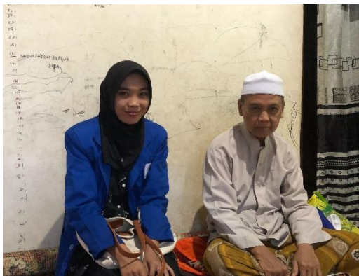
Wawancara dengan AH