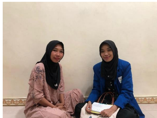
Wawancara dengan I