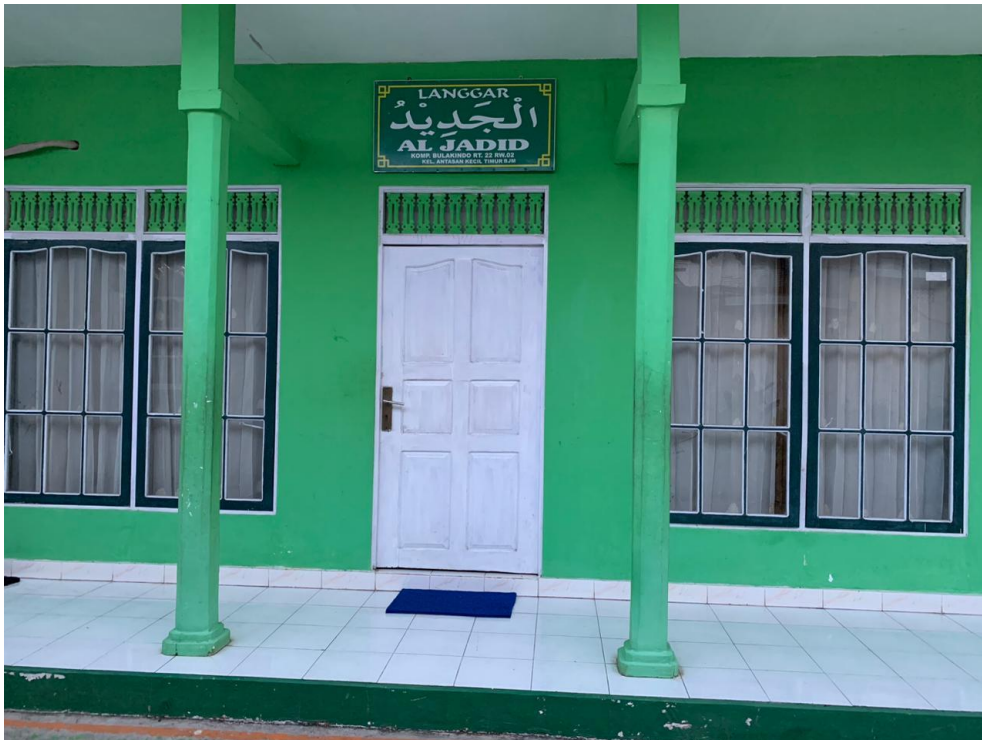
Langgar Al-Jadid Sungai Miai