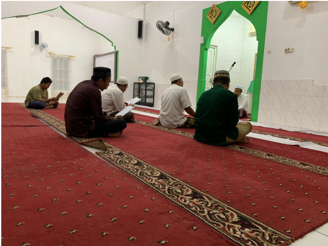
Praktik Pembacaan Hizb Ulul Albab