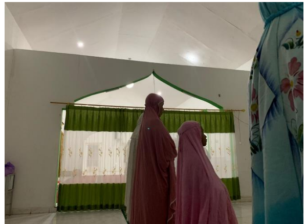
Kegiatan Shalat Isya berjamaah di Langgar Al-Jadid