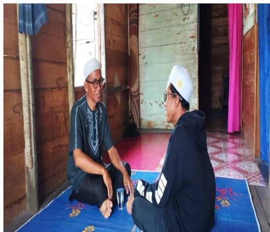
Dokumentasi Wawancara dengan Ahli Sejarah