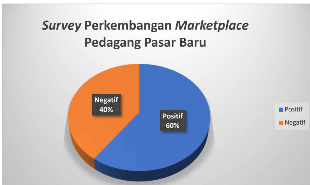
Gambar 4.4 Survey Perkembangan Marketplace Pada Pedagang Pasar Baru

sosial media sebagai bahan promosi ada 3 orang pedagang, sedangkan pedagang yang tetap bertahan dengan usahanya tanpa ada bantuan sosial media ada 2 orang pedagang. Berikut hasil data dalam bentuk survey :