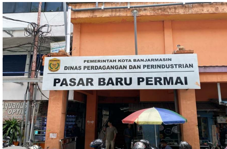
Gambar 1.4 Pasar Baru Permai Kota Banjarmasin

Tanah dan Bangunan Pasar baru permai, yang terdiri dari tanah seluas 2.158 m 2 , bangunan seluas ± 5.664 m 2 yang terletak di Jalan Pasar Baru Permai Banjarmasin, Kelurahan Kertak Baru Ilir, Kecamatan Banjarmasin Tengah Kota Banjarmasin, Provinsi Kalimantan Selatan. Pasar ini merupakan pusat perdagangan di daerah tersebut