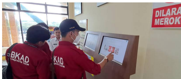
Gambar 4.2 Penggunaan Tapin Cerdas

“Ada juga digital library, jadi ada semacam aplikasi juga digital library dalam hal ini ini kita mengembangkan Tapin Cerdas Digital Library. Nah itu penggunaan dari awal, dari masuknya, kemudian minjamnya, dan kemudian membacanya itu melalui perangkat elektronik atau melalui android.” 56