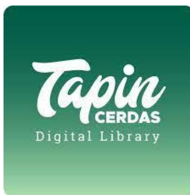
Gambar 4.4 Tapin Cerdas Digital Library

Adapun Digital Library , semacam aplikasi khusus dari Dinas Perpustakaan dan Kabupaten Tapin yang dapat mengembangkan “ Tapin Cerdas Digital Library ”.