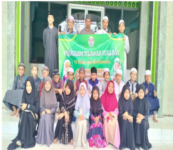
Santri Program Tilawah Full Day Sekolah Tilawah Al-Qur'an