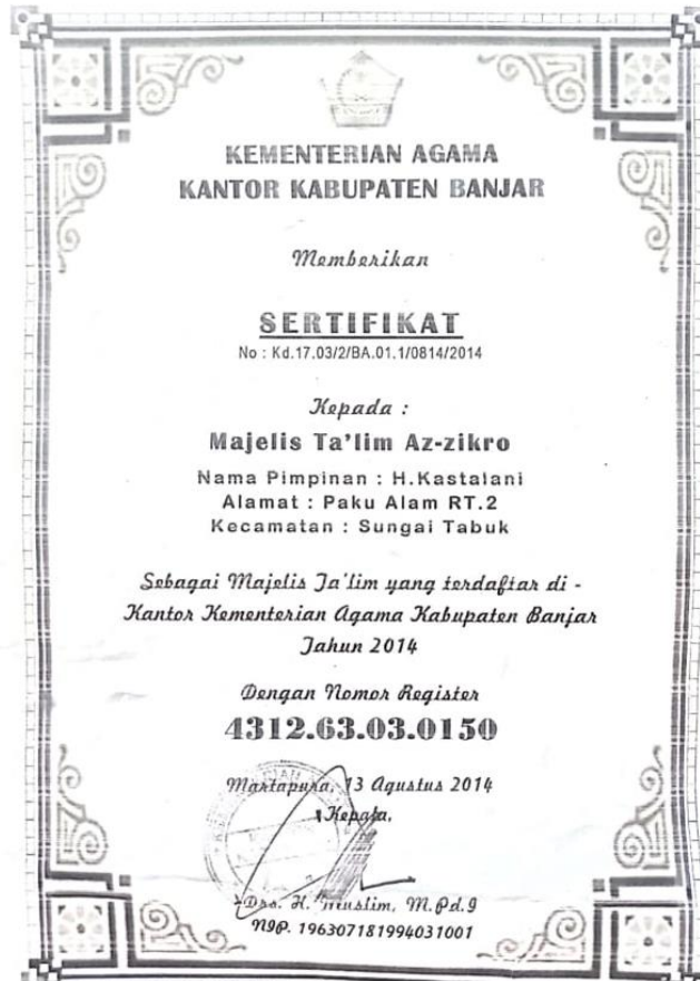
Gambar 4.1. Sertifikat Majelis Ta'lim Az-Zikro

Selain dari wawancara terlihat dari sertifikat majelis ta'lim: 2