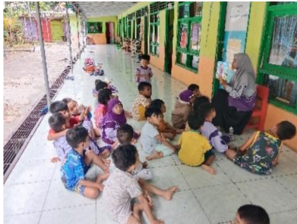
Gambar 4.12 Kegiatan Story Time (CDFPSH.12) 82

rapi menghadap ustadzah sambil mendengarkan cerita yang dibawakan ustadzah, cerita yang didengarkan yaitu cerita keislaman yang menceritakan tentang kisah teladan Nabi Muhammad Saw. kurang lebih 30 menit cerita tersebut pun selesai.