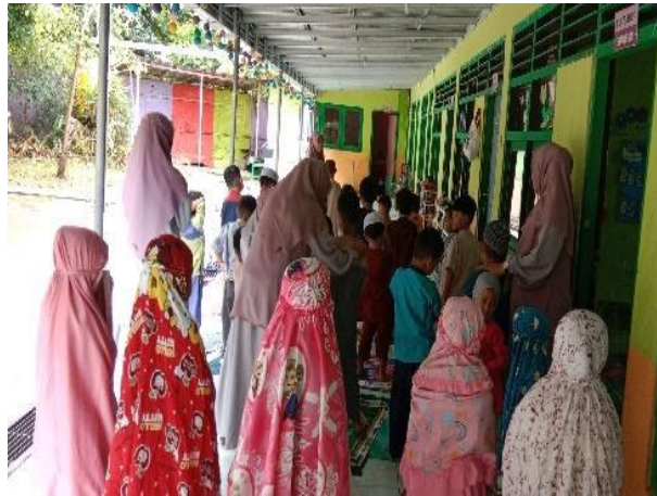
Gambar 4.16 Pelaksanaan Sholat Dhuha Setiap Hari Jum'at (CDFKPM.3) 93

membaca bacaan sholat dan tak lupa juga bimbingan dan bantuan dari ustadzah dalam bacaan bacaan dan gerakan anak sholat. Sampai pada pada salam. Kemudian anak melipat dan mengembalikan sajadah mereka ke tempat semula. CO.190124.TKB4.2. 92