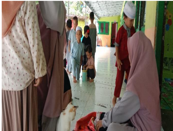
Gambar 4.17 kegiatan sedekah Jumat (CDFKPM.4) 95

masing-masing dan langsung memasukkan uangnya ke dalam celengan secara bergantian. Dalam hal ini tidak ada paksaan dari para ustadzah, jika anak tidak ada yang membawa uang atau lupa tidak apa-apa. CO.190124.TKB4.3 94