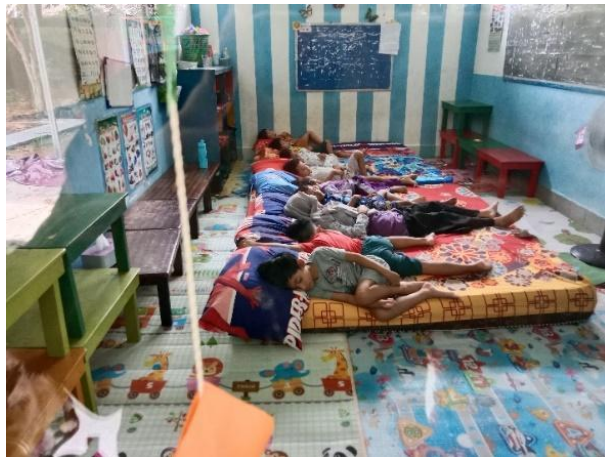
Gambar 4.13 Tidur Siang (CDFPSH.13) 86

Lima belas menit berlalu peneliti pun izin lagi untuk melihat dan mengamati anak lagi dan benar saja anak-anak sudah pada tertidur. Tidur siang ini anak perempuan dipisah dengan anak laki-laki. Dua ruangan untuk tempat tidur anak laki-laki dan satu ruangan untuk anak perempuan tidur.