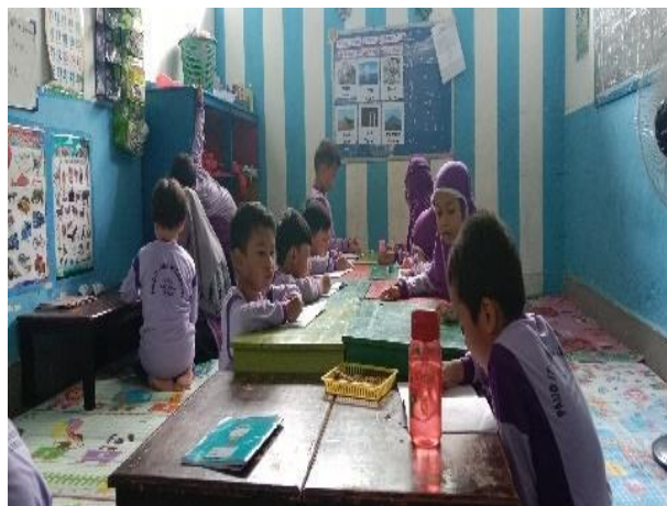
Gambar 4.4 Kegiatan Anak Menulis (CDFPSH.4) 62

Ustadzah sudah selesai menjelaskan materinya, anak-anak diminta untuk menulis kata “ Stone ” di buku tulis mereka, sebanyak satu lembar di buku tulis. Anak-anak duduk lesehan dengan bertumpu pada meja untuk menulis. CO.160124.TKB2.2 61