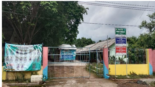
Gambar 4.1 Gedung Sekolah PAUD IT ANIC Banjarbaru (CDFFS.1) 45

PAUD IT ANIC didirikan sejak 21 Oktober tahun 2017 sampai sekarang. Sekolah Islam Terpadu (SIT) pada hakikatnya adalah sekolah yang mengimplementasikan konsep pendidikan Islam berdasarkan Al-Qur'an dan As-Sunnah. Konsep sekolah Islam terpadu merupakan akumulasi dari proses pembudayaan, pewarisan, dan pengembangan nilai-nilai Islam dalam peradaban islam.