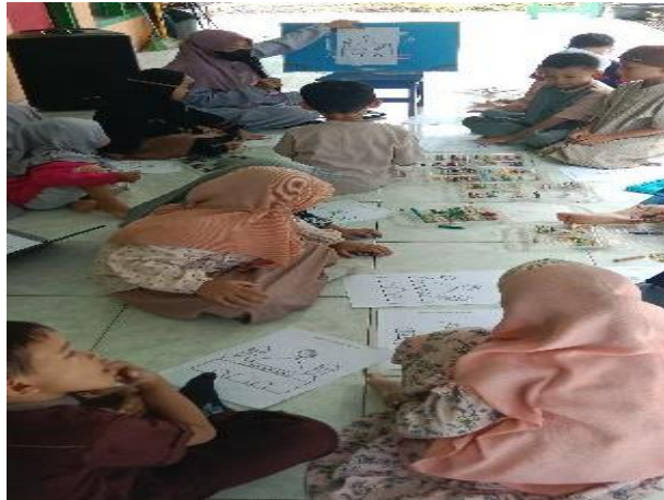
Gambar 4.18 Kegiatan Ekstrakurikuler mewarna Setiap Jum'at