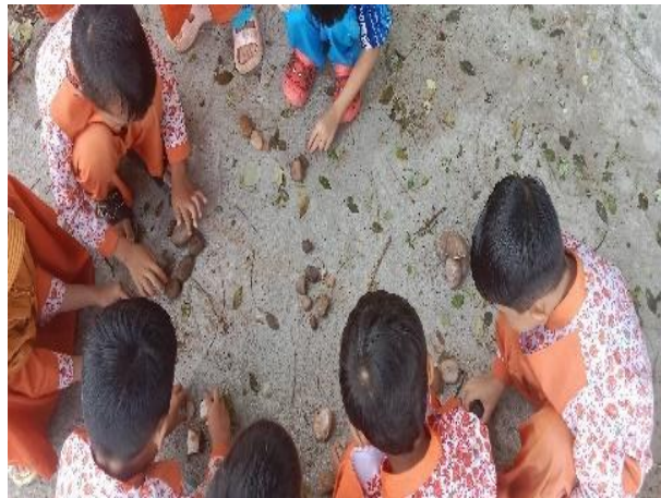
Gambar 4.9 Kegiatan Tadabur Alam (CDFPSH. 9) 75

sosial emosionalnya. Ustadzah nya pun juga menjelaskan siapa yang menciptakan batu, jenis jenis batu dan kembali mengulang materi yang ada di dalam kelas. CO.160124.TKB2.7 74