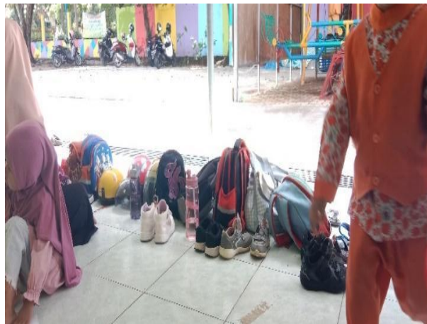
Gambar 4.11 Anak yang Half daya menunggu jemputan (CDFPSH.11) 81

ganti baju untuk kegiatan berikutnya. Sedangkan yang halfday tetap memakai pakaian seragam sekolah. Anak yang sudah ganti baju duduk rapi di teras sekolah untuk mendengarkan cerita atau dongeng sambil menunggu yang lain ganti baju, anak-anak bermain di halaman sekolah. Ustadzah menyiapkan barang barang untuk anak yang halfday seperti: tas, sepatu, botol minum dan helm disusun sejajar di depan teras. Peneliti lihat disini ada anak yang sudah dijemput dan ada juga yang belum di jemput. CO.160124.TKB2.9 80