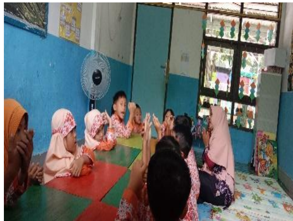
Gambar 4.7 Anak Membaca Doa Senandung Al-Qur’an (CDFPSH.7) 68

“Allah rahmati kami dengan Al-Qur’an, jadikan ia pimpinan, cahaya, petunjuk, dan rahmat, Allah ingatkan kami apa yang terlupa ajarkan lah yang tak diketahui rezekikan kami membacanya, siang dan malam sepanjang siang dan malam, jadikan ia penolong kami ya rabbal ‘alamin.