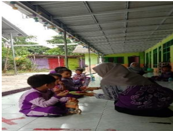
Gambar 4.3 Makan Buah Sebelum Masuk Kelas (CDFPSH.2) 57

Kegiatan selanjutnya setelah circle makan makan buah dan ustadzah memberikan potongan buah naga untuk setiap anak satu potongan. Dan juga ustadzah bertanya kepada anak menggunakan bahasa inggris “ you like dragon fruits? ” dan anak-anak menjawab “ yes, i like ustadzah ”. CO.180124.TKB3.2 56