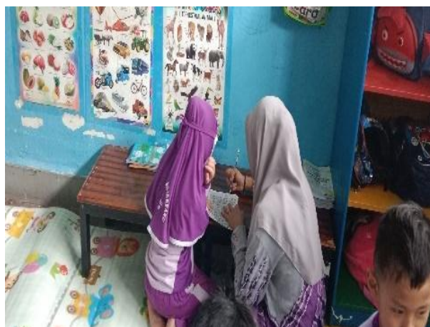
Gambar 4.6 Kegiatan Anak Belajar Membaca (CDFPSH.6) 65

Selanjutnya anak yang sudah setoran hafalan surah akan melanjutkan ke ustadzah satunya untuk kegiatan membaca, dalam kegiatan membaca anak dibantu dengan buku membaca yang dimiliki oleh setiap anak.