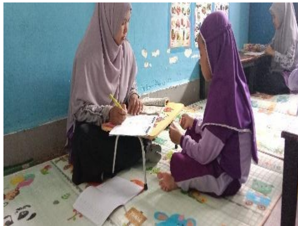
Gambar 4.5 Kegiatan Anak Setoran Hafalan (CDFPSH.5) 64

lagi agar anak itu hafal juga seperti teman-teman yang lainnya. (CWGTKA.1). 63 Hafalan surah anak akan dituliskan kedalam kartu prestasi siswa tahfidz dan murojaah PAUD IT ANIC Banjarbaru.