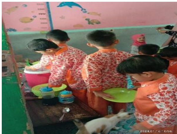
Gambar 4.10 Kegiatan Anak Makan Siang (CDFPSH.9) 79

Pada pukul 11.00-11.40 WITA selanjutnya anak-anak mencuci tangan kembali dan masuk kedalam kelas. Saat sudah didalam kelas ustadzah kembali bertanya jawab lagi mengenai kegiatan diluar kelas. Setelah itu anak anak kembali membaca doa mau makan beserta artinya jika sudah anak selang waktu lima belas menit anak langsung keruang makan untuk makan siang bersama-sama. CO.160124.TKB2.8 78