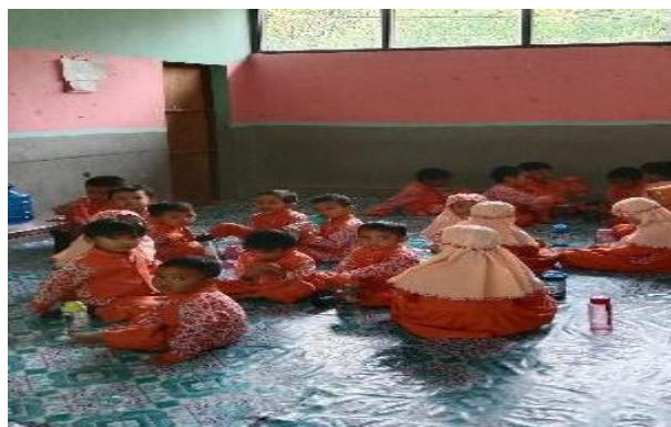
Gambar.4.8 Persiapan Anak Makan Snack (CDFPSH.8) 71

Anak dilatih untuk melakukan adab-adab makan seperti makan menggunakan tangan kanan, makan nya duduk, melatih untuk menjaga kebersihan di ruang makan, makan tidak berhamburan dan selesai makan sampahnya dibuang ketempat sampah. Setelah anak-anak selesai makan kue bolu anak-anak lanjut mencuci tangan kembali dan kembali ke dalam kelas mereka untuk melanjutkan ke pembelajaran inti. CO.160124.TKB2.4 70