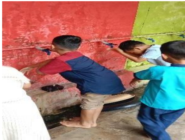
Gambar 4.15 Anak-anak Berwudhu Sebelum sholat Dhuha

pembelajaran inti dan anak-anak diminta berwudhu terlebih dahulu sebelum melaksanakan kegiatan sholat dhuha yang biasa dikerjakan di hari setiap hari jum'at. CO.190124.TKB4.1. 90 Metode yang saat pembelajaran ini adalah metode praktek langsung. Yang dilakukan oleh semua anak dari tingkatan KB (kelompok bermain), TK A dan TK B.