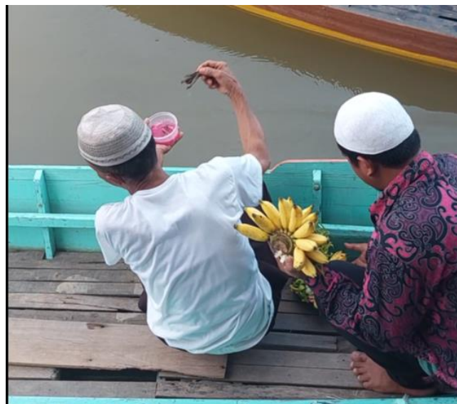
Gambar 16. Pelaksanaan pada Saat Balabuh Sasaji