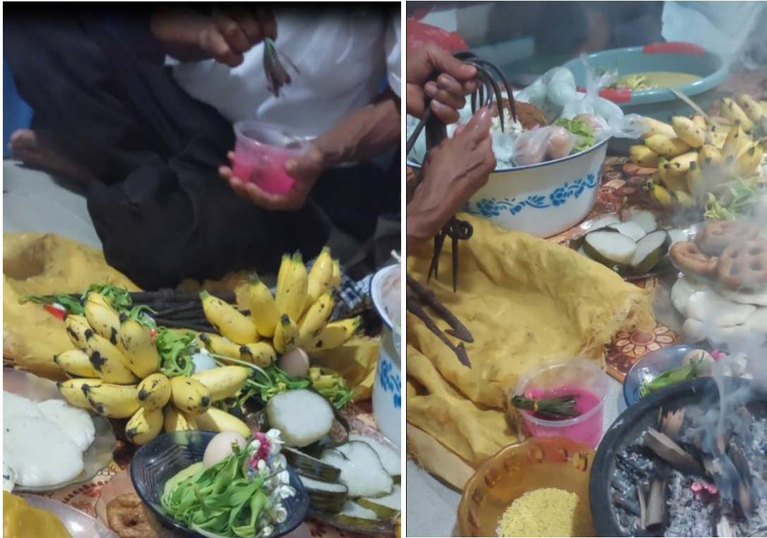
Gambar 15. Persiapan Balabuh Sasaji dan pembersihan wasi tuha ( marabun )