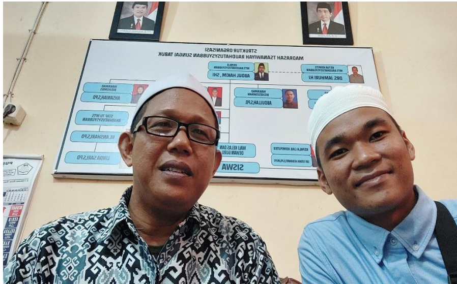
gambar 4. Wawancara dengan tokoh agama (desa Sungai Bakung)