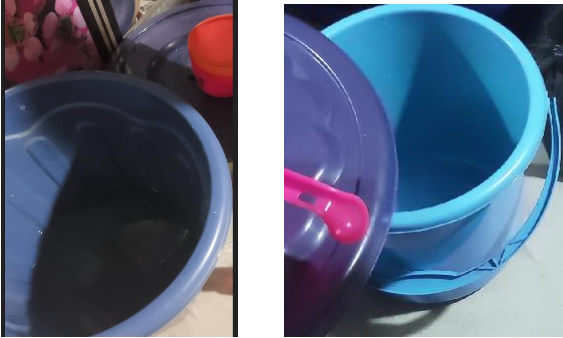
Gambar 10. Wadah untuk mengambil air pada saat balabuh sasaji