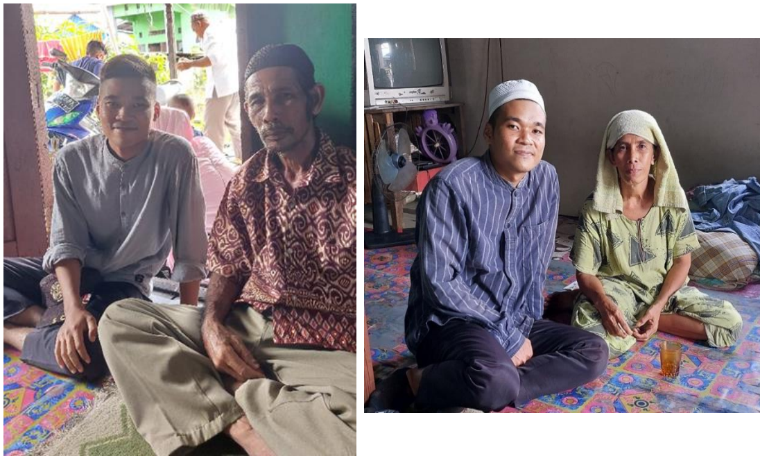
Gambar 8. Orang yang ikut melaksanakan tradisi