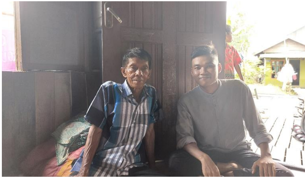
Gambar 7. Wawancara dengan Tatuha ritual