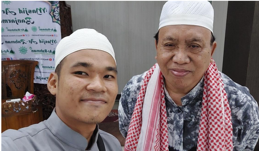
gambar 5. Wawancara dengan ulama (luar desa Sungai Bakung)