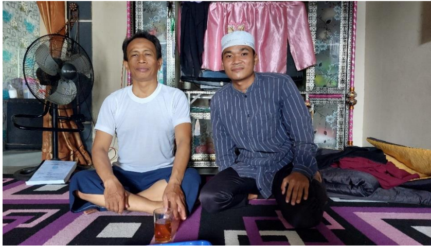
gambar 3. Wawancara dengan tokoh agama (desa Sungai Bakung)