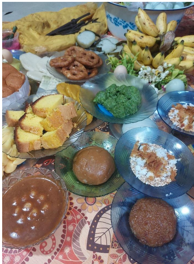
Gambar 14. Tapung tawar , menyan dan beberapa macam wadai pada saat tradisi dilaksanakan