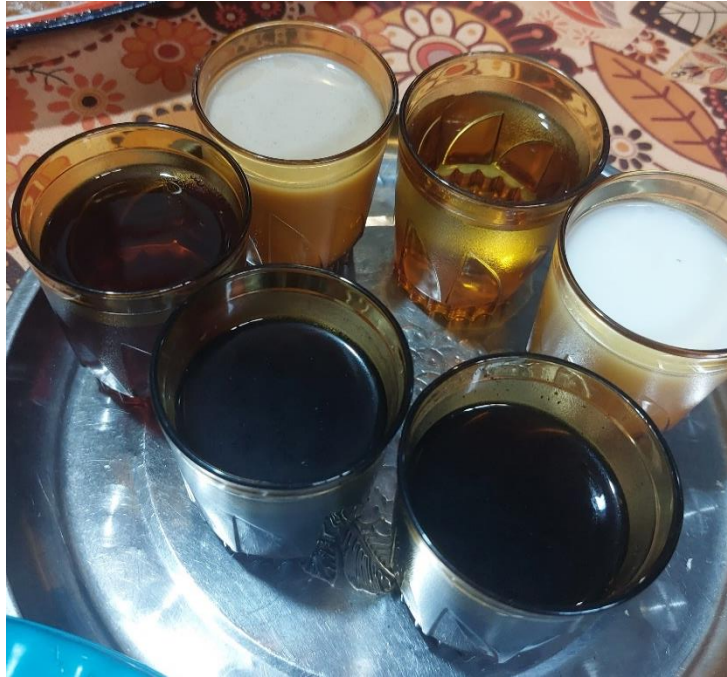
Gambar 12. Kopi pahit, manis, susu dan air putih sebagai pemberian kepada orang kayangan