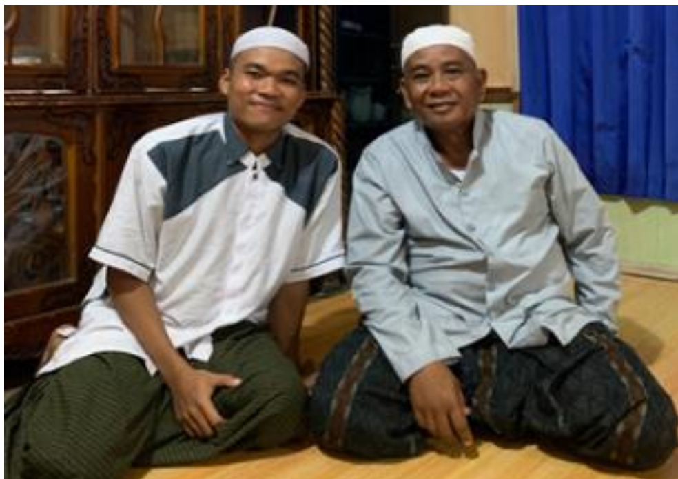
Gambar 2. Wawancara dengan ulama (luar desa Sungai Bakung)