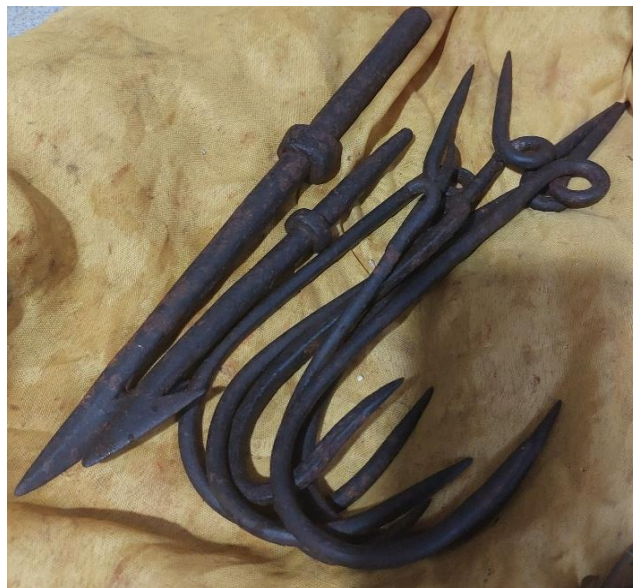
Gambar 13. Wasi tuha berbentuk kawat sebagai penangkal atau pengusir yang tidak baik pada saat tradisi dilaksanakan