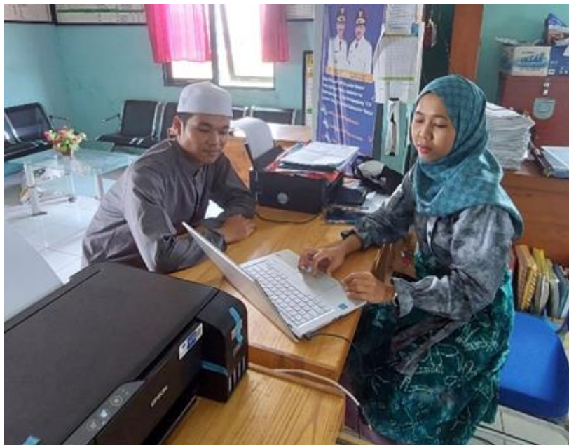
Gambar 6. Wawancara dengan Kasi Kesejahteraan dan Pelayanan