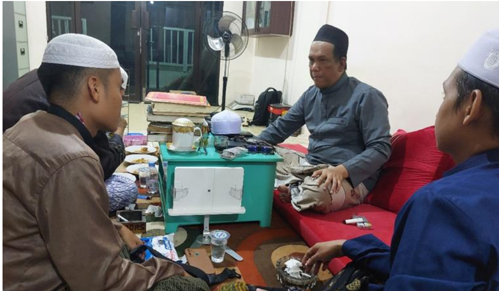
Gambar 1. Wawancara dengan ulama (luar desa Sungai Bakung)