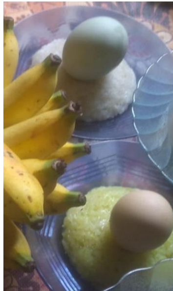
Gambar 11. Lakatan putih, kuning dan telur ayam, bebek, pisang mahuli untuk balabuh