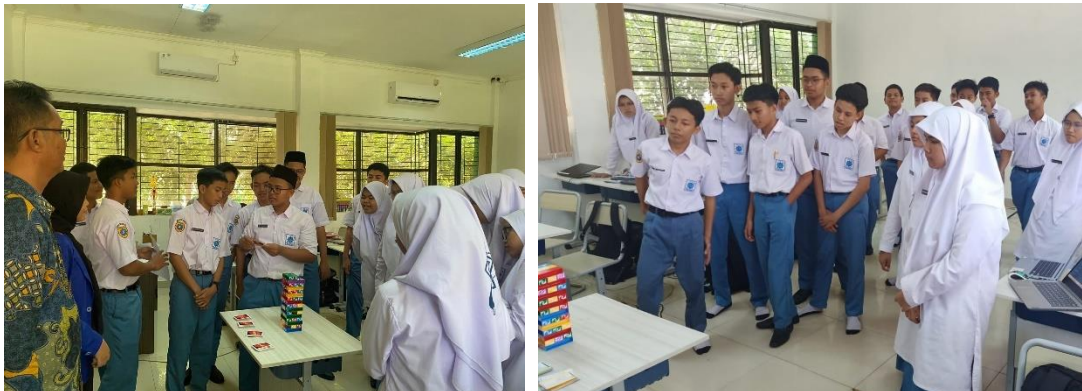
Gambar 5.4 Guru menjelaskan aturan permainan Uno Stacko Sejarah Kebudayaan Islam