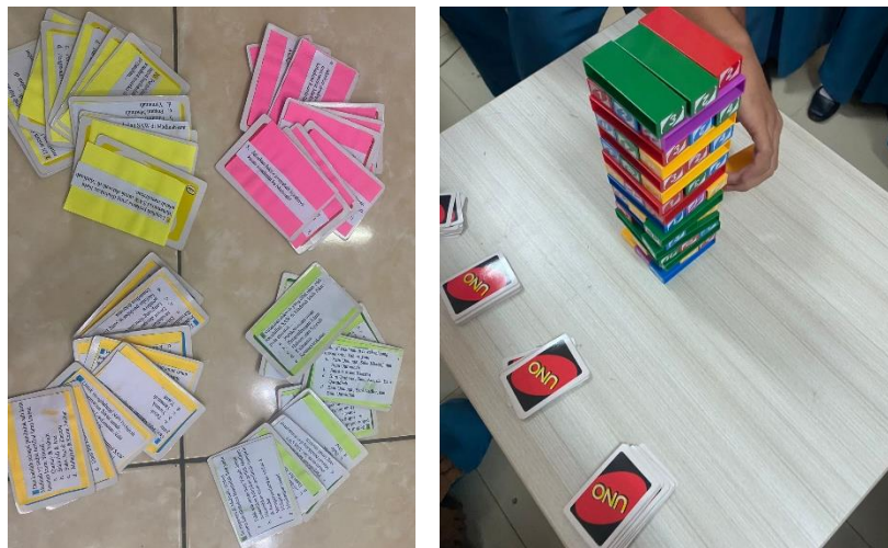
Gambar 5.2 Kartu Uno dan Menara Uno Stacko