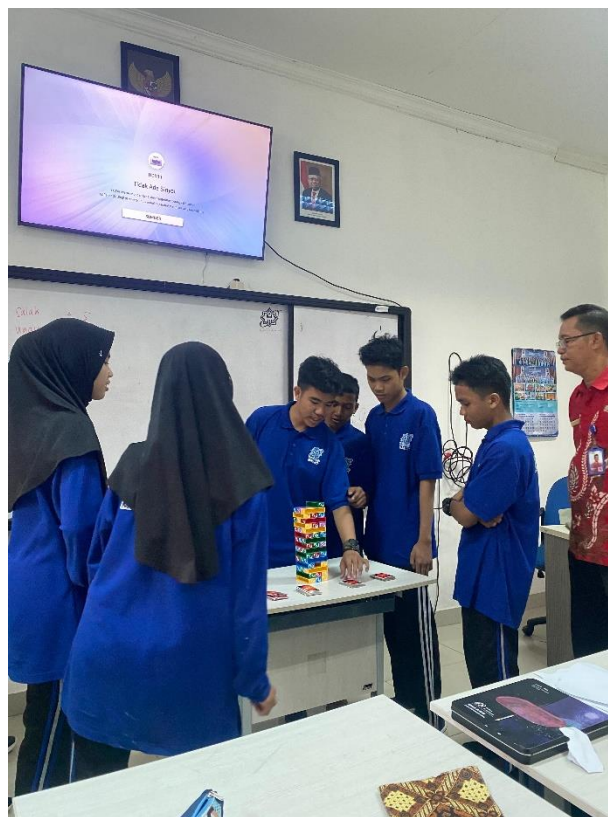
Gambar 5.6 observasi pertama dan kedua di Kelas X-D