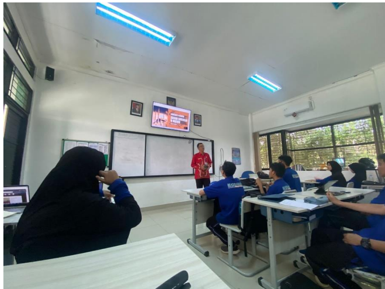
Gambar 5.3 Guru menjelaskan materi menggunakan power point yang ditampilkan di smart tv .