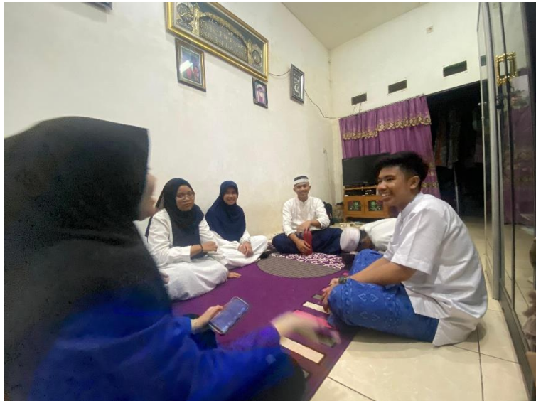
Gambar 5.7 wawancara dan observasi awal dengan siswa siswi