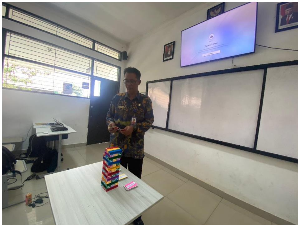
Gambar 5.8 wawancara dengan guru Sejarah Kebudayaan Islam