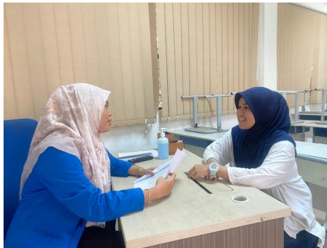
Gambar 5.9 Wawancara dengan siswa-siswi kelas X-C dan X-D