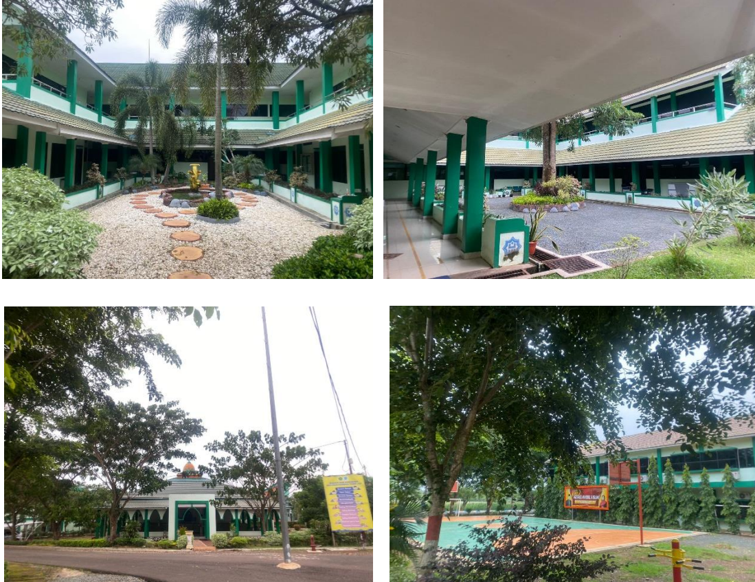
Gambar 5.1 Dokumentasi Kawasan Madrasah Aliyah Negeri Insan Cendekia Kabupaten Tanah Laut