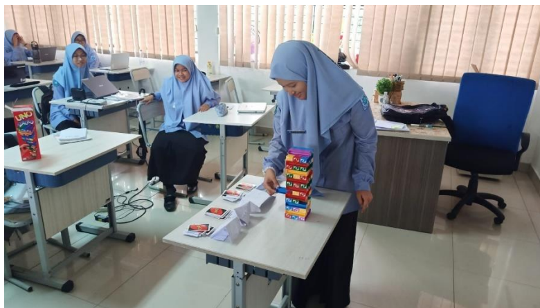
Gambar 5.5 observasi pertama dan kedua di Kelas X-C