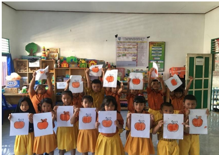
Gambar 2.6 Hasil kegiatan posttest sablon pola gambar Apel