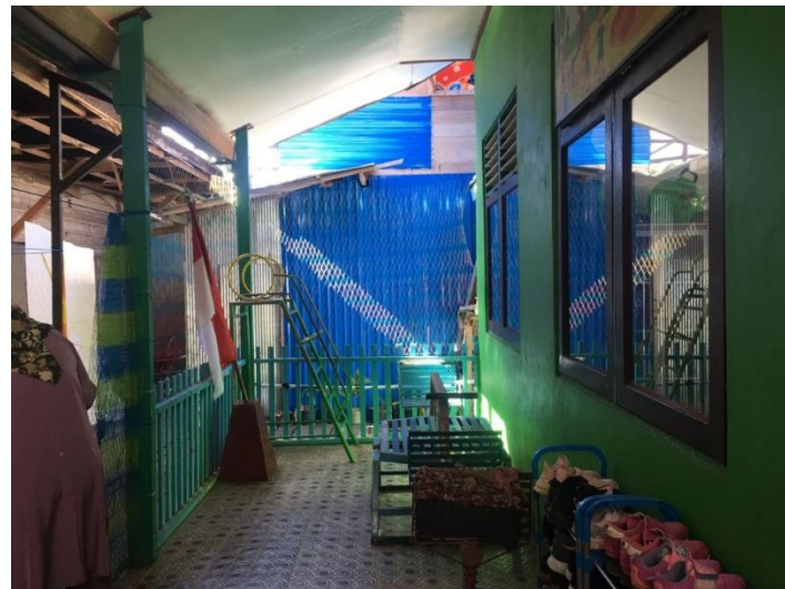
Gambar 2.2 Keadaan APE outdoor