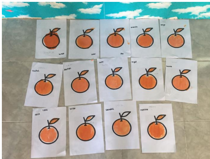
Gambar 2.4 Treatment 1 hasil anak menyablon pola gambar buah jeruk