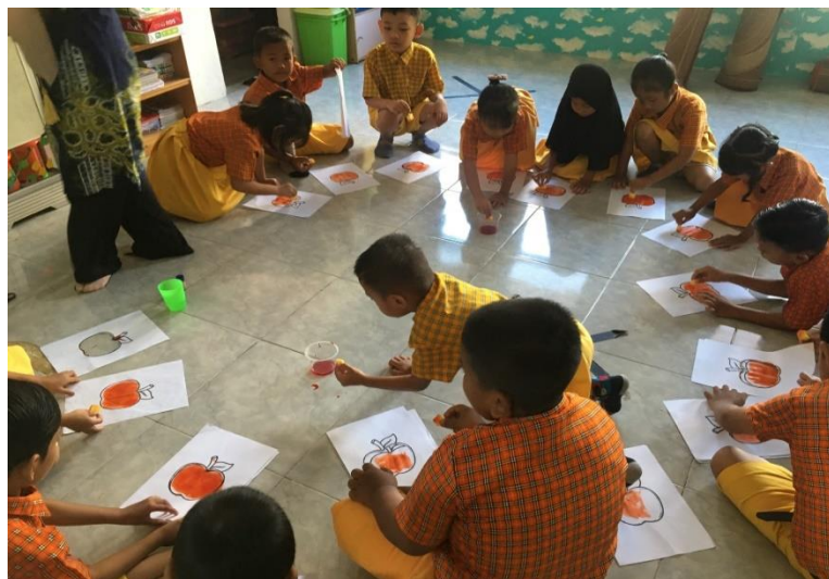
Gambar 2.5 Posttest menyablon pola gambar Apel