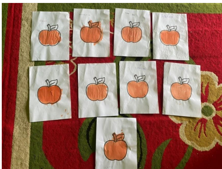
Gambar X Hasil Sablon Anak Pola Apel Pretest

Berikut hasil menyablon 9 anak yang perkembangan motoriknya pada saat pretest sudah mulai berkembang dan mengalami peningkatan perkembangan saat posttest menjadi lebih baik dari hasil penilaian yaitu 75,00 Ananda Aisya Humaira, 91,67 Diskha Azqia, 91,67 Khairunnisa, 91,67 Marshall Riyad Al fath, 83,33 Muhammad Ali Wafa, 91,67 Muhammad Aqil, 75,00 Muhammad Iqlil, 91,67 Noor Hanifa, dan 75,00 Salsabil.