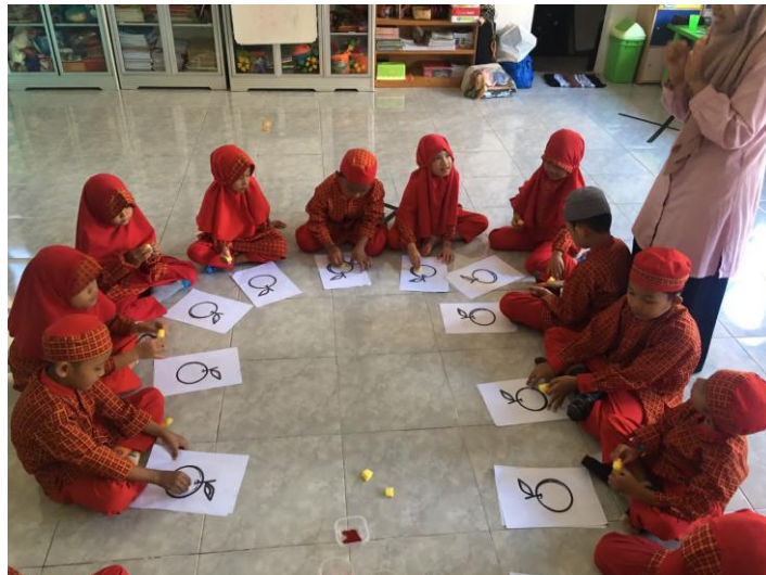
Gambar 2.3 Treatment 1 anak menyablon pola gambar buah jeruk