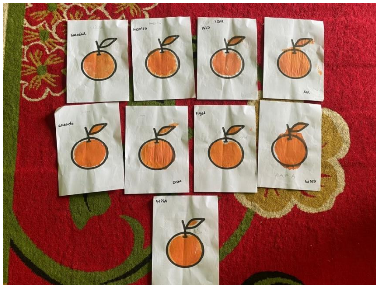
Gambar IX Hasil Sablon Sederhana Mulai Berkembang (MB)

Berikut hasil sablon sederhana 9 anak yaitu Ais, Da, Kh, Ma, Ri, AW, MA, MI, NH, dan Sa yang perkembangan motorik halusnya sudah mulai berkembang (MB) namun masih meminta bantuan guru saat menyablon.