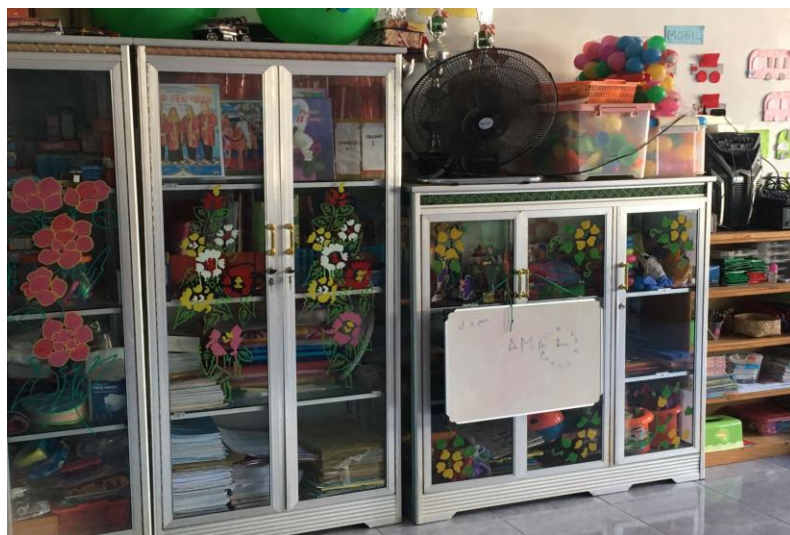
Gambar 2.1 APE Paud Sentosa