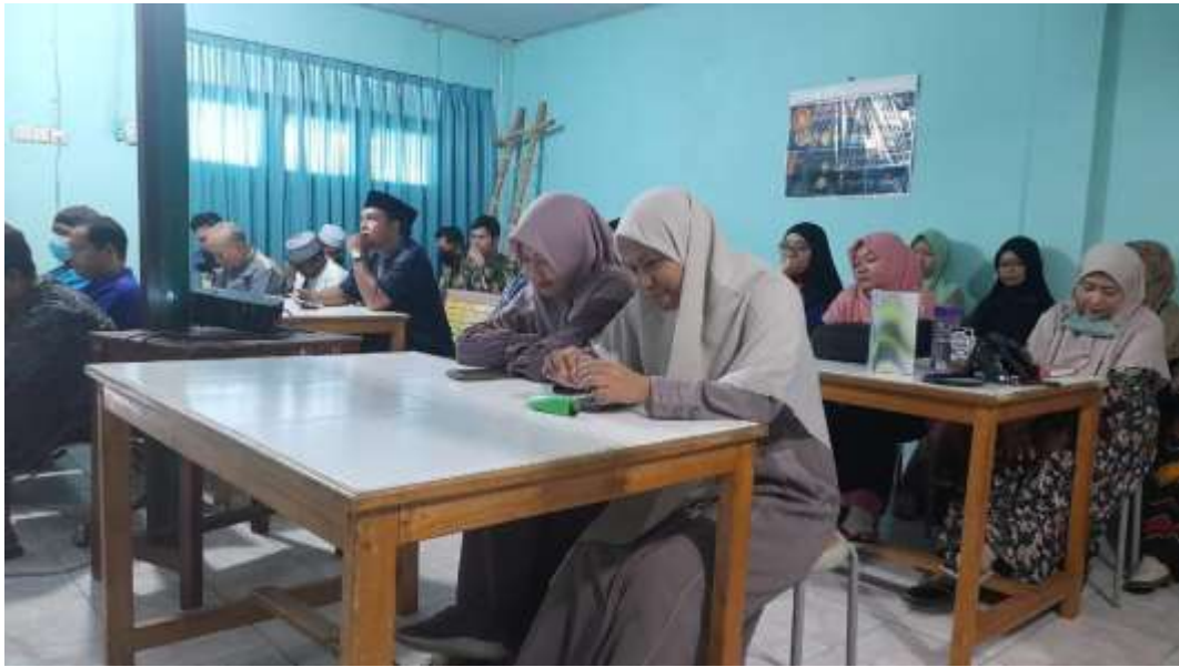
Kepala Madrasah sebagai Leader