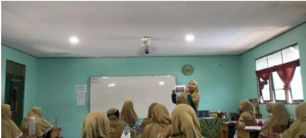
Kepala madrasah sebagai Supervisor