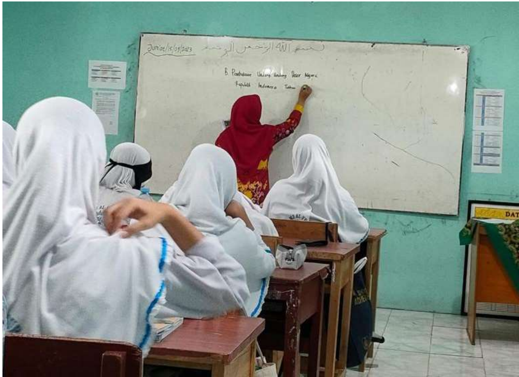
Kepala madrasah sebagai Educator