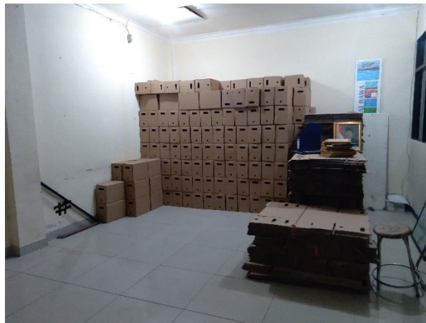
Gambar 4. 15 Box-Box Arsip Yang Telah Dianggarkan

Berdasarkan hasil wawancara tersebut dalam pendanaan kearsipan di Balai Teknik Rawa Banjarmasin telah dialokasikan sesuai dengan kebutuhan pengelolaan kearsipan baik secara operasional maupun non-operasional. Pendanaan ini juga berlaku pada perpustakaan yang ada di Balai Teknik Rawa Banjarmasin.