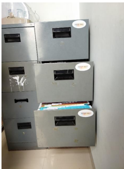
Gambar 4. 8 Penyimpanan Arsip Aktif di Filling Cabinet

“Aktif itu pasti kita sesuai standarnya bahwa kita menggunakan filling cabinet, kita menggunakan filling cabinet, terus di dalam filing cabinet itu menggunakan map gantung dan ditulis klasifikasi arsipnya, kami juga mengklasifikasikan sesuai dengan peraturan. Di dalam filling cabinet itu ada map gantung yang diberi kode klasifikasi arsipnya. Jadi kami menyimpan arsipnya sesuai dengan kode klasifikasi di dalam map gantung, di dalam filling cabinet tadi. Hanya ruang penyimpanannya saja yang tidak khusus (karena) arsip aktifkan arsip yang penggunaannya masih cukup tinggi, jadi ruang penyimpanan itu di ada ruangan di sampingnya sekertaris kepala balai, karena untuk seluruh arsip balai kebetulan kita belum punya arsiparis jadi penyebutannya adalah pengelola arsip. Nah pengelola arsip itu untuk Balai semua terpusat di sekertaris kepala Balai.” 54