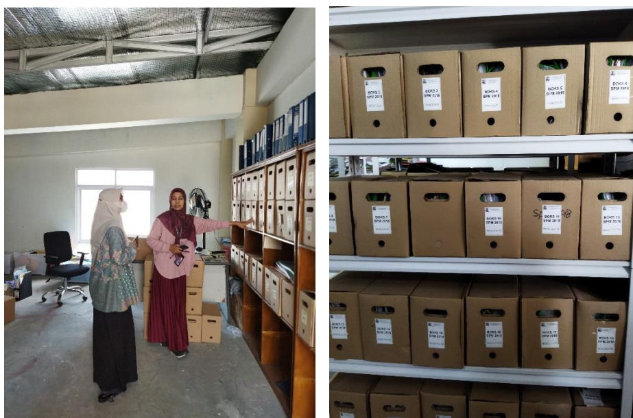
Gambar 4. 14 Prasarana dan Sarana di Record Center

“Kalau sapras mulai dari untuk arsip aktif tadi kita sudah menggunakan sesuai dengan standarnya menggunakan filling kabinet, menyiapkan ruangan walaupun bukan ruang khusus maksudnya masih tercampur. Kemudian inaktif kami memiliki ruang arsip sendiri, kami memiliki lemari penyimpanan itu kalau pengadaannya sih baru ya. Kalau lemari penyimpanan dalam bentuk roll o ppack yang seperti berangkas, kami baru pengadaan tahun 2023 karena memang keterbatasan anggaran kami sebelumnya. Kemudian selama ini kami menggunakan rak-rak arsip, di mana arsip-arsip inaktif itu dimasukkan ke dalam box-box sesuai dengan klasifikasinya tentunya, jadi kami melakukan administrasi pengelolaan arsip sebagaimana yang diberlakukan PERMEN PUPR. Di dalam ruangan itu harus terjaga kelembapannya nah itu kami pun memasang termometer ruangan untuk pengatur suhu. Ruangan itu juga tidak boleh lembab, jadi kami tidak memasang ac, tapi menggunakan kipas angin exhouse pan dan kipas angin dan pencahayaan yang cukup. Saprasnya itu sesuai standar yang sudah ditentukan terus untuk perangkat pengolah data mendukung kearsipan mulai dari PC, Printer dan untuk box-box itu kemarin pesen box nya yang kosong sehingga untuk pelabelan kami menggunakan printer label, jadi nanti label itu ditempelkan langsung di box nya.” 63