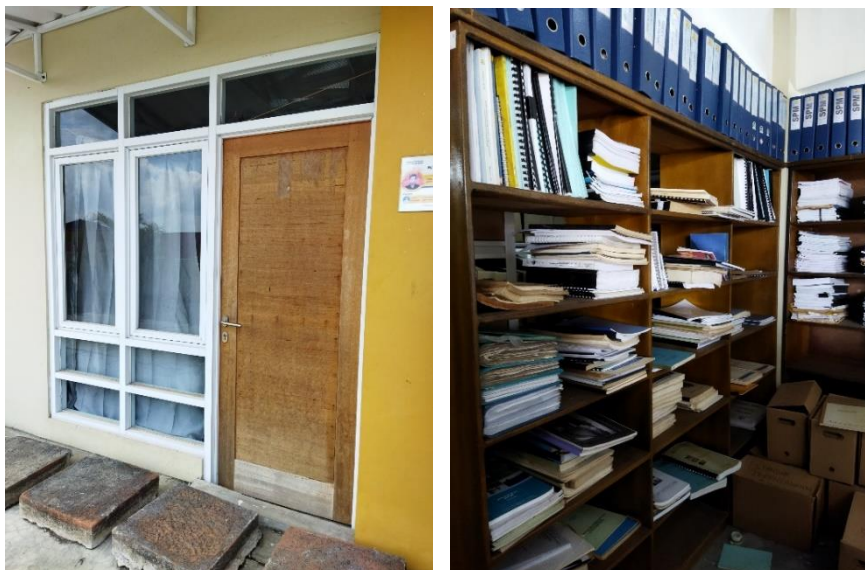
Gambar 4. 7 Ruang Record Center

“Kalau untuk arsip inaktif, kami memiliki ruang khusus, itu ada di lantai 3 gedung kantor ini.” 53