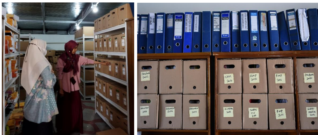
Gambar 4. 11 Penyimpanan Arsip Inaktif Pada Box-Box Arsip

kami sudah menscreening, kapan dia akan inaktif jadi sehingga dia inaktif kami mensortir, kami melakukan, kami membungkus membando, memasukan dalam box, mengadministrasikan dia dibox berapa di rak berapa, jadi lebih mudah. Tapi kalau saat ini kan masih belum ada ya, karna kan kita belum melakukan inaktif jadi apalagi retensikan, jadi kami belum melakukan seperti itu.” 57