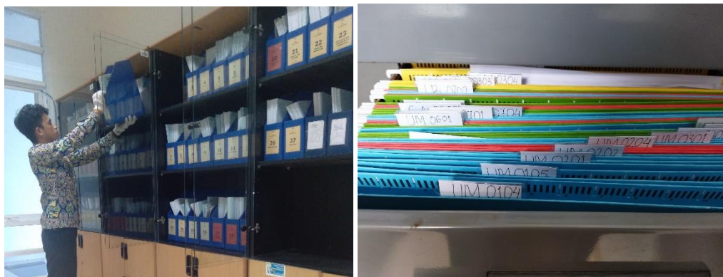
Gambar 4. 10 Penataan Arsip Aktif