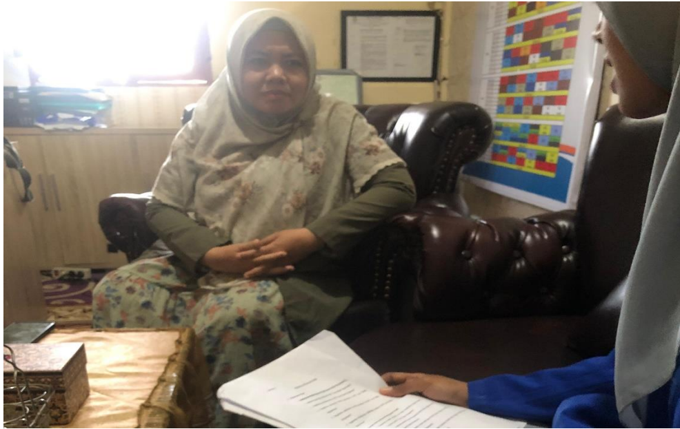
Wawancara dengan Kepala Sekolah