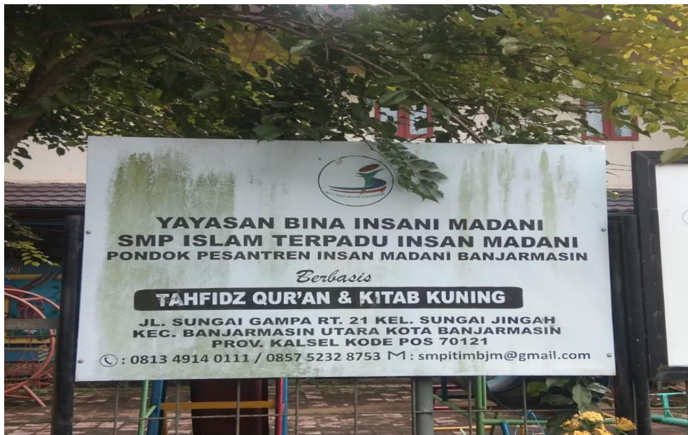
Tampak Depan Sekolah