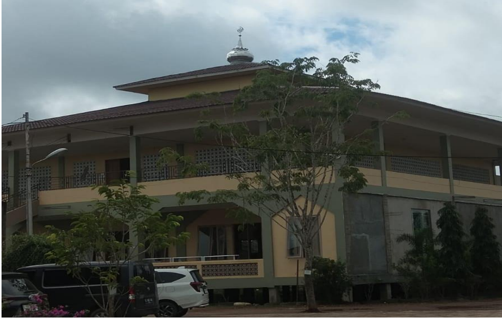
Masjid sekaligus ruang kelas putra