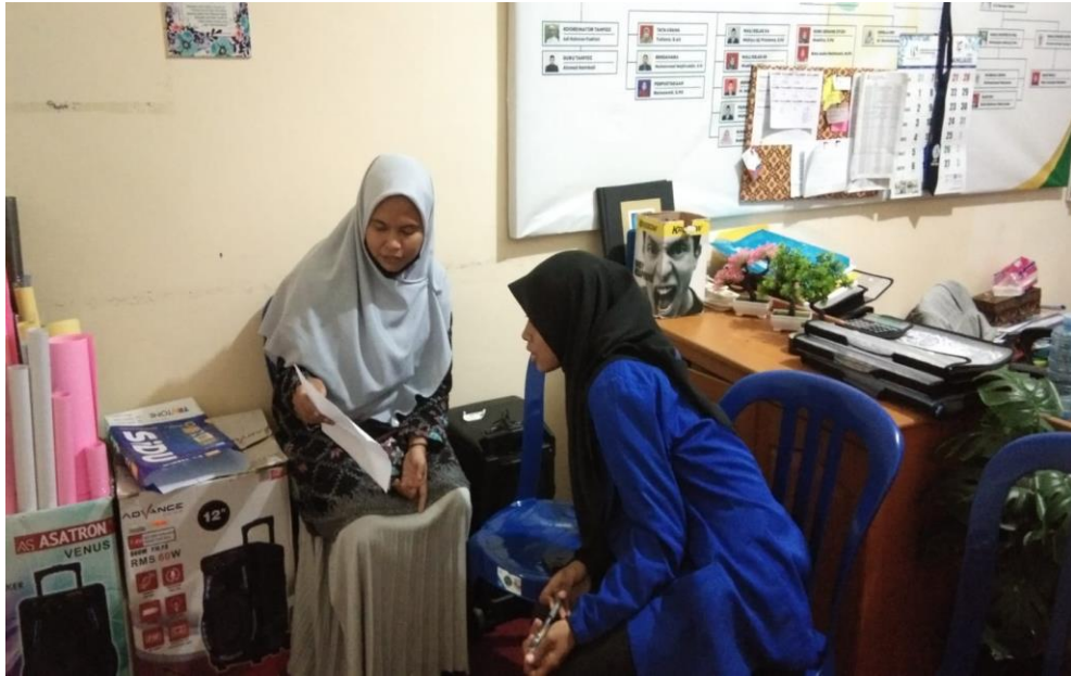
Wawancara dengan Wakil Kepala Sekolah Bidang Kesiswaan