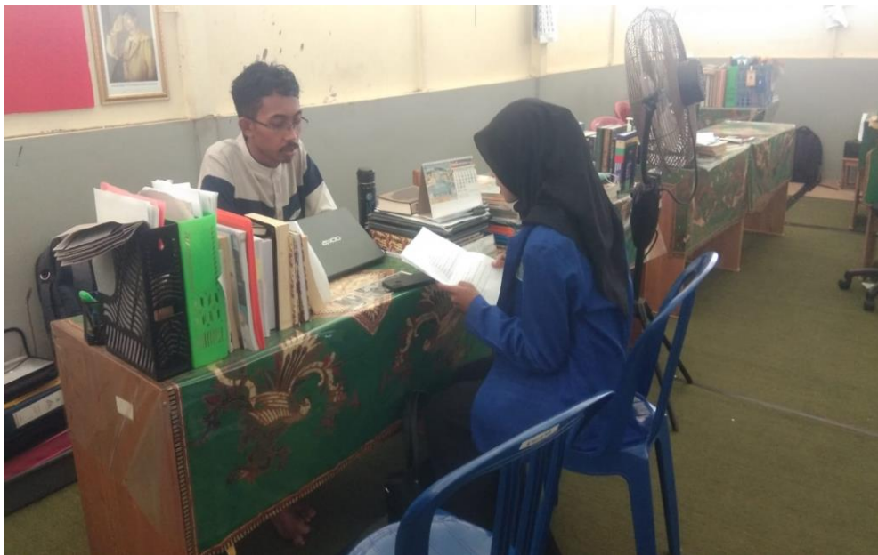
Wawancara dengan WAKA Kurikulum