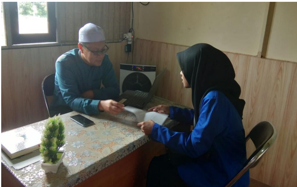
Wawancara dengan Koordinator Tim Penjaminan Mutu