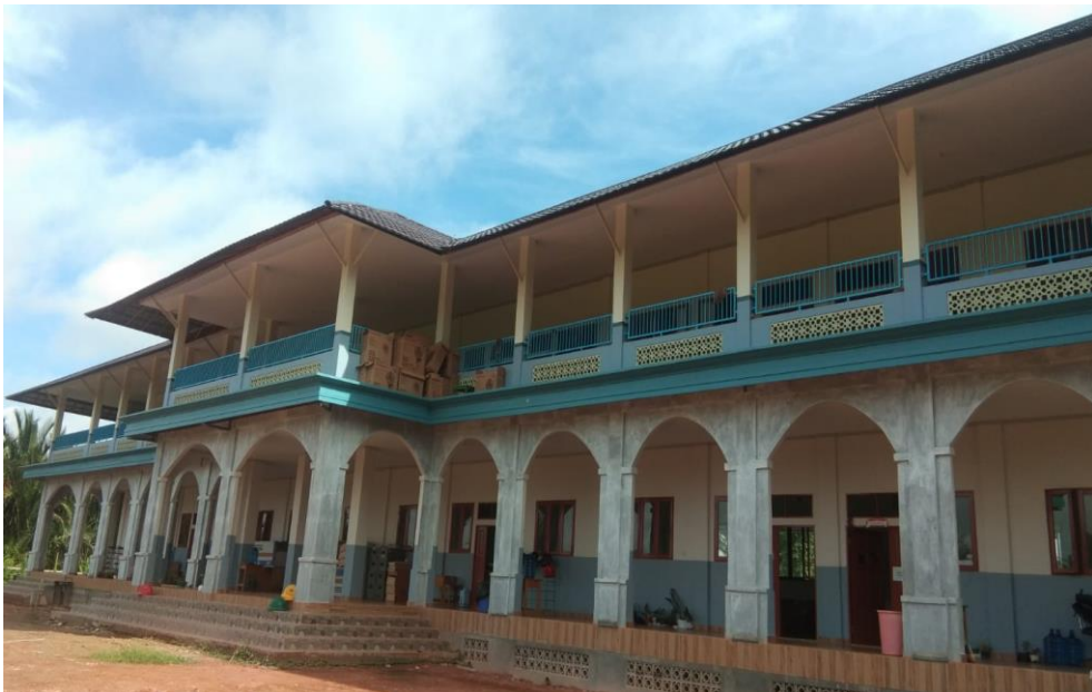
Gedung kelas putri