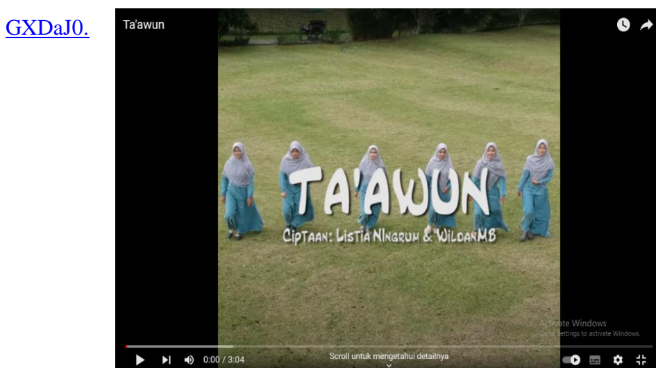
Gambar 4.5 Lagu Ta'awun

Selain menggunakan video-video cerita keteladanan, pelajaran hadis-hadis. Para guru juga mempelajari lewat lagu-lagu yang berisi arahan serta nasihat bagi siswa agar siswa dapat merasa senang dan gembira sambil bernyanyi mempelajari sikap ta'awun. Salah satu lagu yang diterapkan oleh para guru memiliki makna tidak membully teman, kasih sayang sesama manusia, dan sebagainya, berikut contoh lagu yang berisi tentang sikap ta'awun https://www.youtube.com/watch?v=2q7g-GXDaJ0 .