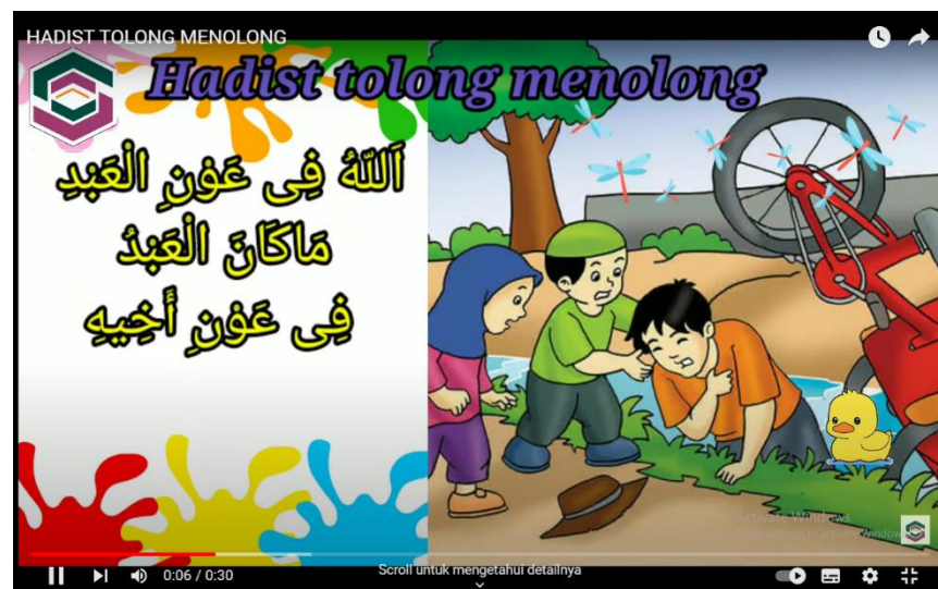
Gambar 4.4 Video Hadis Tolong-Menolong

“Allah senantiasa menolong hamba-Nya, selama hamba tersebut menolong saudaranya..