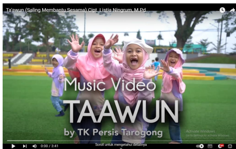
Gambar 4.3 Music Video Taawun

Berikut contoh video mengenai cerita keteladanan untuk menerapkan ta'awun https://www.youtube.com/watch?v=PDexGNRyS1g bertujuan untuk membangun karakter islami sejak dini melalui sikap empati dan menolong sesama.