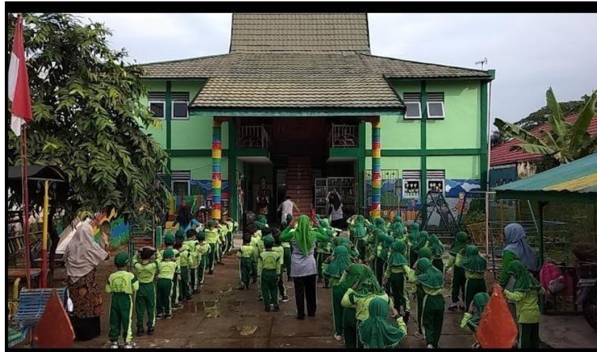
Gambar 4.1 Lokasi Penelitian

Raudhatul Athfal (RA) Uswatun Hasanah, yang beralamatkan: Jl. A. Yani Gang Baru No. 24 F, Kelurahan Tanjung Rema, Kabupaten Banjar, Provinsi Kalimantan Selatan.