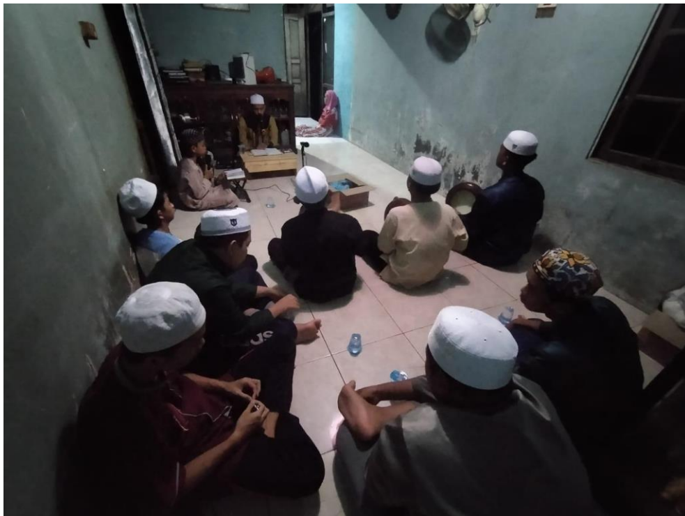
Kegiatan Rutin Majelis Ilmu