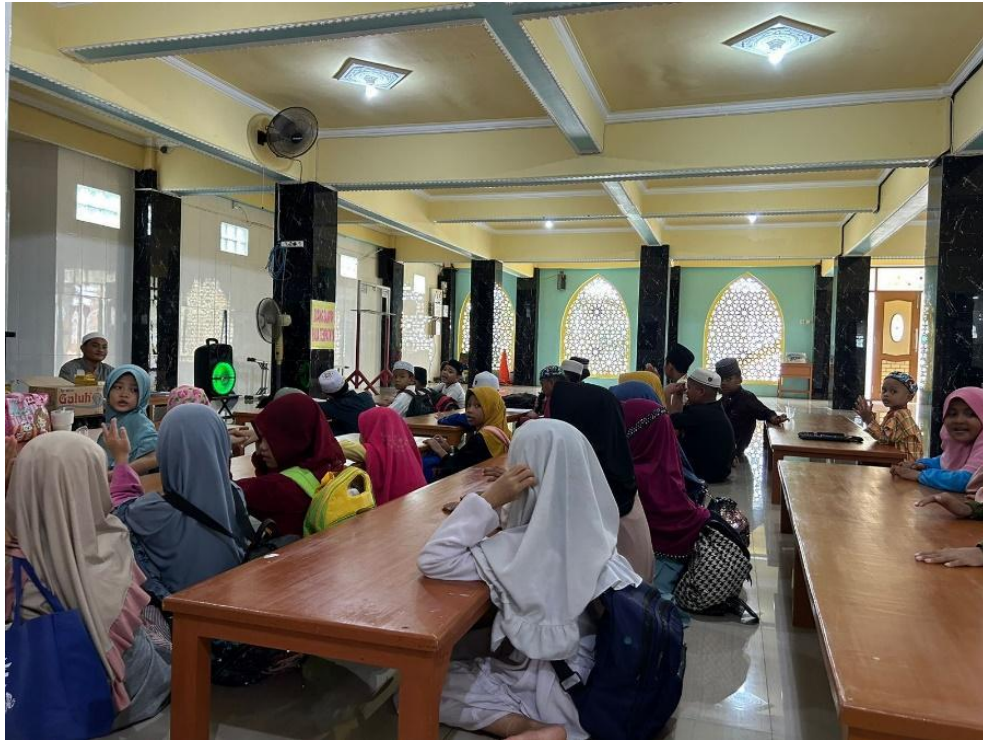
Kegiatan Rutin TPA (Taman Pendidikan Al-Qur'an)