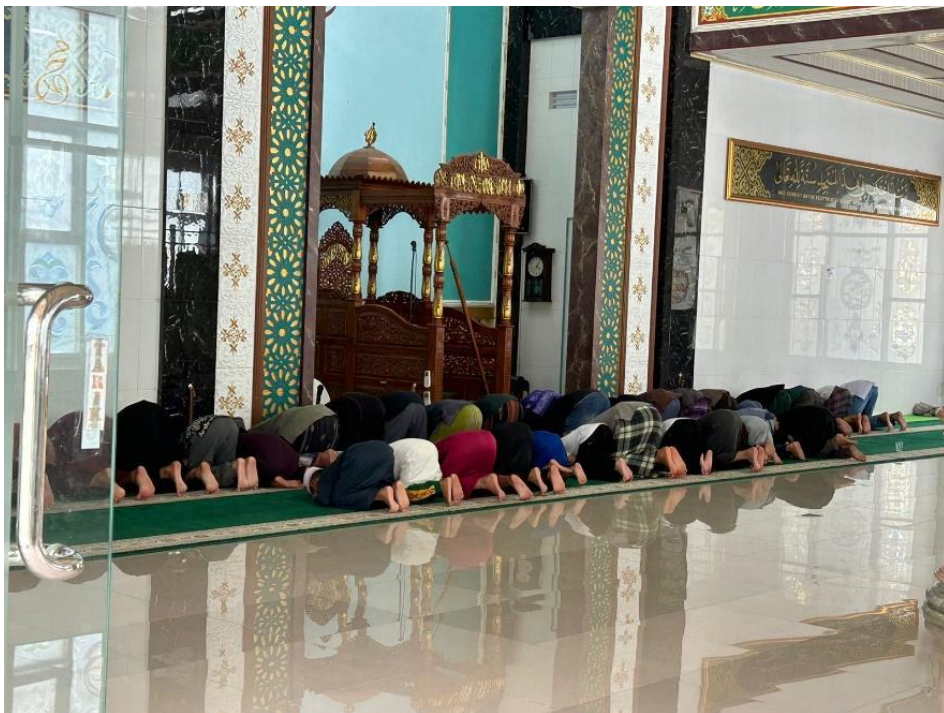
Kegiatan Keagamaan Sholat Berjamaah