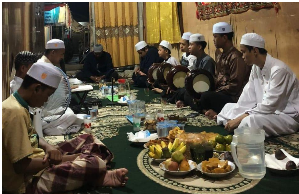
Kegiatan Rutin Maulid Habsyi