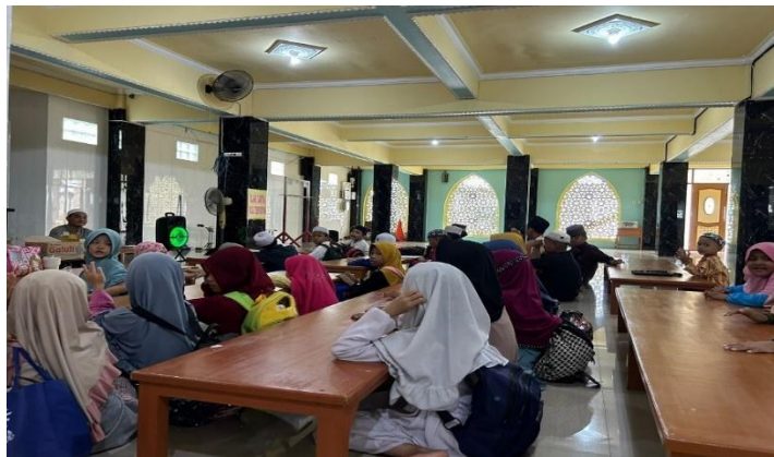
Gambar 4. 3 Kegiatan TPA