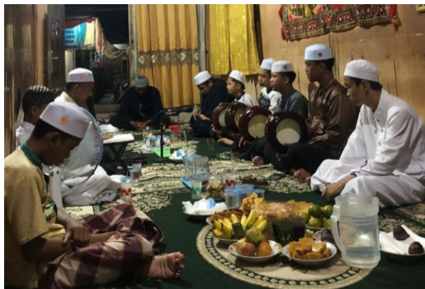
Gambar 4. 4 Kegiatan Maulid Habsyi

Dari hasil wawancara di atas dapat dilihat bahwa pembinaan akhlak remaja melalui Kegiatan Keagamaan di Pengambangan Banjarmasin sangatlah baik karena banyak hal-hal positif yang bisa diambil oleh para