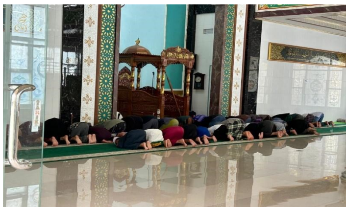
Gambar 4. 1 Kegiatan Sholat Berjamaah

“Sholat berjamaah rutin dilaksanakan sebelum kegiatan majelis ilmu, TPA dan juga maulid habasyi. Jadi sebelum memulai Kegiatan Keagamaan tersebut kami sholat terlebih dahulu, seperti majelis ilmu yang dilaksanakan ba’da isya, otomatis kami melaksanakan sholat isya, dan begitupun dengan kegiatan lainnya. Ini bertujuan untuk menambah kedisiplinan, kebersamaan, dan ketaatan kepada agama.” (Ustadz Syarwani: B80-B89)