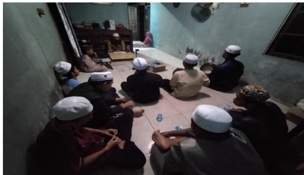
Gambar 4. 2 Kegiatan Majelis Ilmu