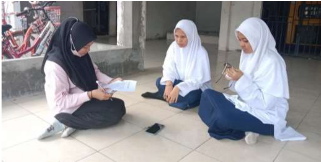
Gambar IV : Pembelajaran Malam