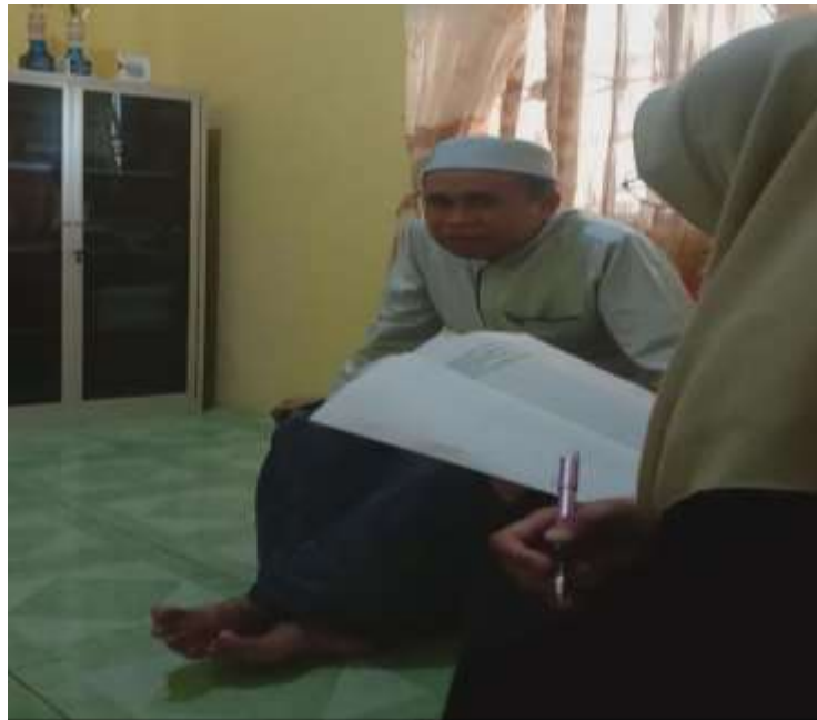
Gambar II : Wawancara dengan bidang keamanan dan musyrifah (Ibu Asrama)