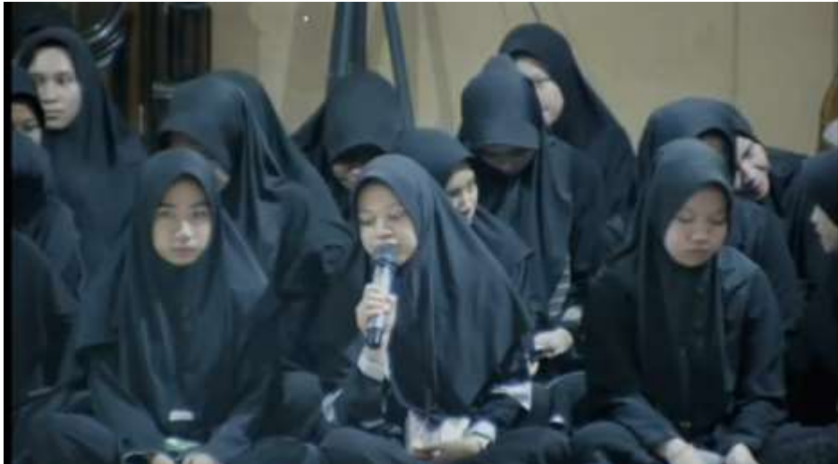
Gambar X : Pembacaan Burdah Setiap Malam Jum'at