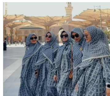
(Burj Khalifa scarf & The Memoraya Scarf)

Tag line La Sabelle berupa “ scarves, collection, and modest lifestyle: doing what sisters do ” menyimbolkan hijab La Sabelle sebagai pengaruh gaya hidup perempuan yang layak untuk dikoleksi dan bisa melakukan kreasi apapun dalam aktivitasnya. Monogram LS yang berada di belakang sisi hijab menegaskan bahwa monogram tersebut memiliki peran penting sebagai simbol identitas merek bahwa ia