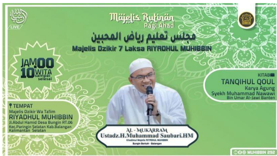
Gambar 4. 3 Template Kegiatan MD.PP Riyadhul Muhibbin