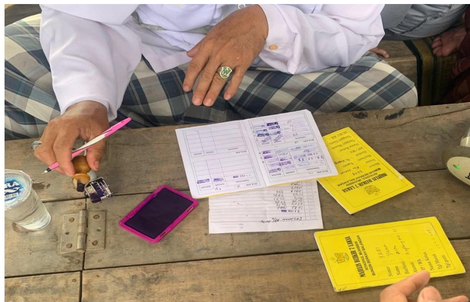
Gambar 4. 5 buku jamaah dzikir