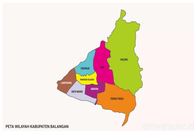
Gambar 4. 1 Peta Kabupaten Balangan

Kabupaten Balangan adalah salah satu kabupaten yang berada di provinsi Kalimantan Selatan dengan Ibu Kota Paringin. Kabupaten Balangan berlokasi di sebelah utara provinsi Kalimantan Selatan. Secara umum kabupaten Balangan merupakan daerah hulu sungai dari Kalimantan selatan yang sering disebut juga sebagai “Banua Anam”. Kabupaten balangan memiliki luas wilayah 1.828,1225 kilometer persegi dengan garis koordinat 2^{\circ}1'37'' - 2^{\circ}35'58'' Lintang Selatan dan 114^{\circ}50'24'' - 115^{\circ}50'24'' Bujur Timur.