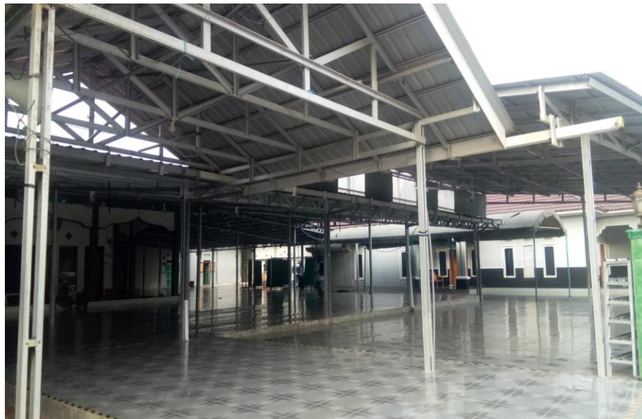
Gambar 4. 2 Tempat MD.PP Riyadhul Muhibbin