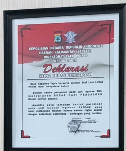
Perubahan Bentuk Uji Praktek SIM keputusan Kakorlantas Polri Nomor: Kep/105/VIII/2023