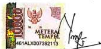
Nurul Fitria Utami