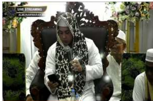
Gambar 4.5 peringatan Maulid di Masjid Besar Al-Munawwarah