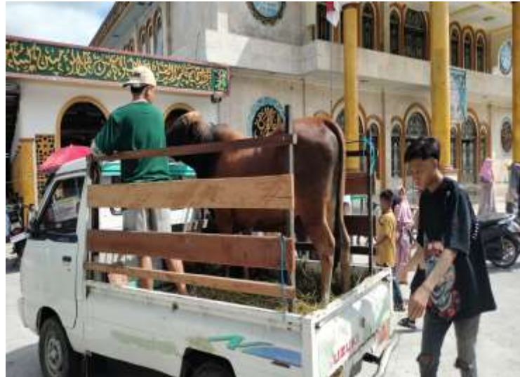
Gambar 4.4 kegiatan Qurban di Masjid Al-Munawwarah