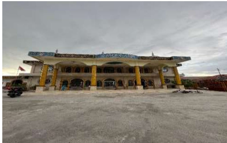
Gambar 4.1 Masjid Al-Munawwarah Buntok dari depan