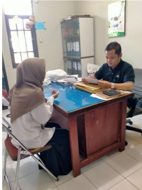
Gambar 1. Permohonan Izin Riset Kepada Kepala Seksi PT. Buana Karya Bhakti di Kabupaten Tanah Bumbu