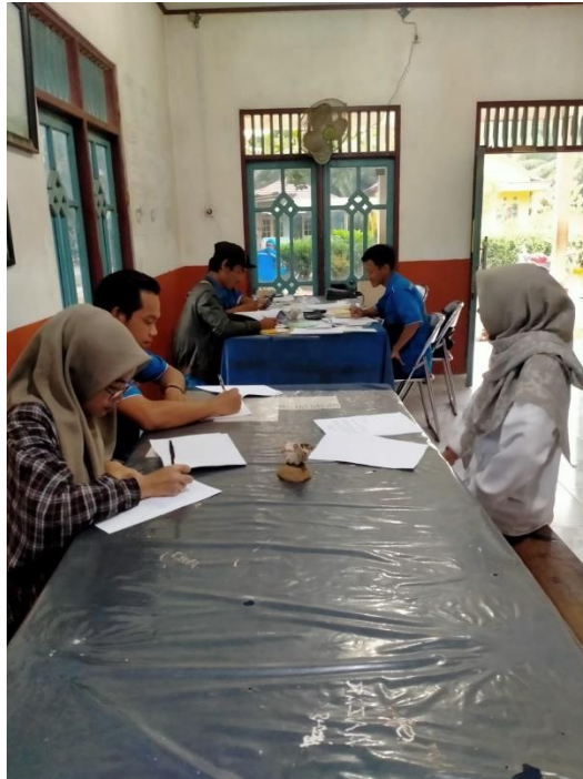
Gambar 3. Pembagian Kuesioner Kepada Responden Penelitian