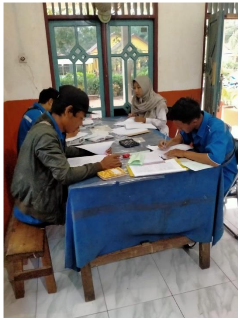
Gambar 2. Pembagian Kuesioner Kepada Responden Penelitian