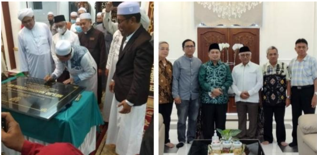
Gambar 4. 4 Peresmian Masjid Nahdhatussalam