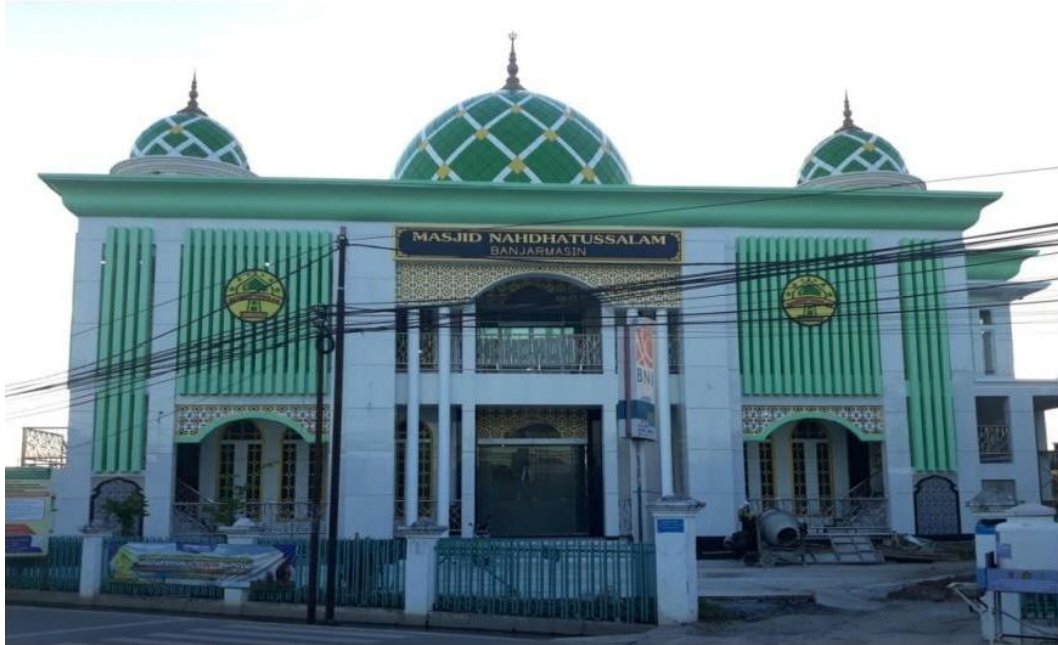
Gambar 4. 3 Masjid Nahdhatussalam sekarang