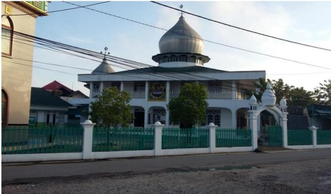
Gambar 4. 2 Masjid Nahdhatussalam Tempo Dulu