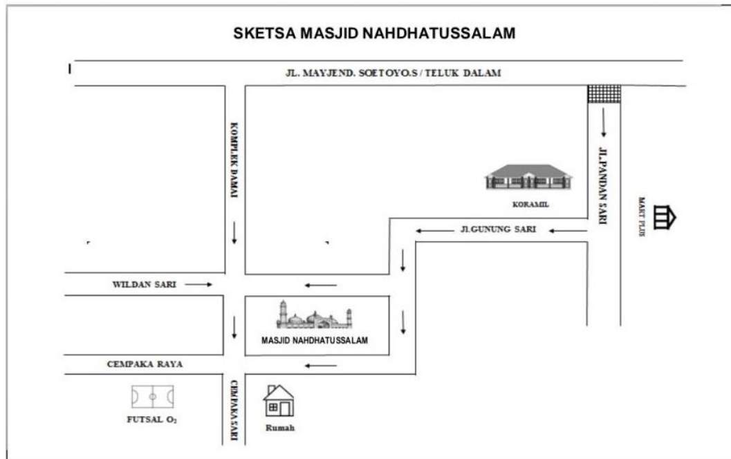
Gambar 4. 1 Denah lokasi Masjid Nahdhatussalam