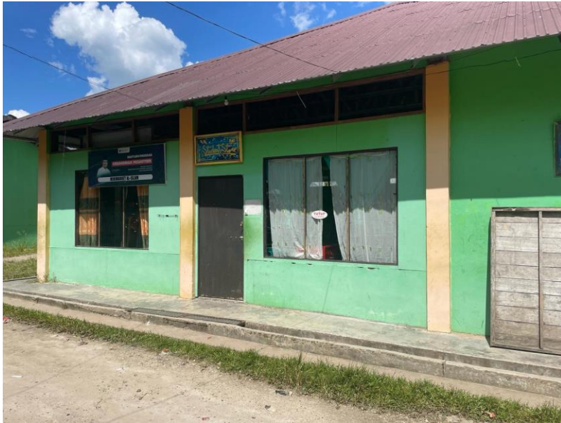
C. Bentuk Kontribusi Koperasi terhadap bangunan di pondok Pesantren Al Islam