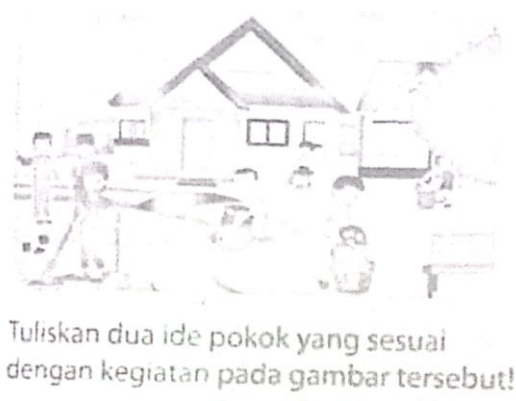
Gambar 4.2 Tugas Membuat Ide Pokok dari Gambar

Kesulitan belajar visual ini ternyata sangat mempengaruhi sekali terhadap pemahaman siswa dalam belajar, karena siswa kesulitan dalam memahami gambar maka siswa juga mengalami kesulitan dalam memberikan ide pokok sebuah tulisan sebagaimana sebuah gambar di bawah ini yang mana siswa diminta guru membuat ide pokok dalam sebuah paragraf dan membuat alur ceritanya: