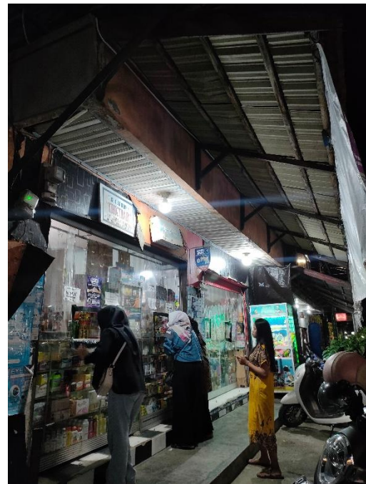
Gambar 6 Wawancara bersama Bapak Reza, 5 Februari 2024