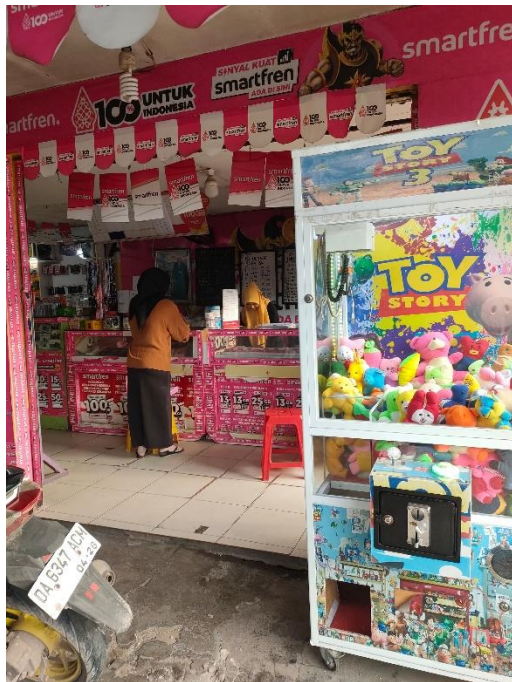
Gambar 5 Wawancara bersama Ibu Ike Sumarni, 10 Februari 2024