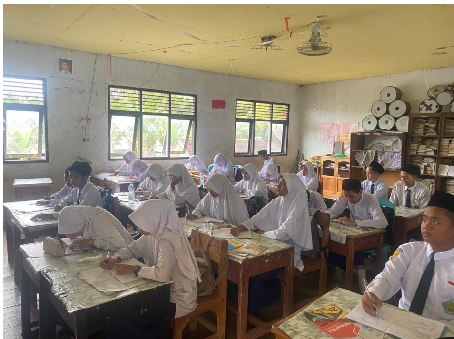
Gambar 4. 1 Pembelajaran di Kelas Eksperimen Pada Pertemuan Pertama

tersebut diubah dalam bentuk matematika sebagai sistem persamaan yaitu 2x + y = 15.000 , dan x + 2y = 18.000 . Kemudian masalah ini dapat diselesaikan dengan menggunakan metode eliminasi.