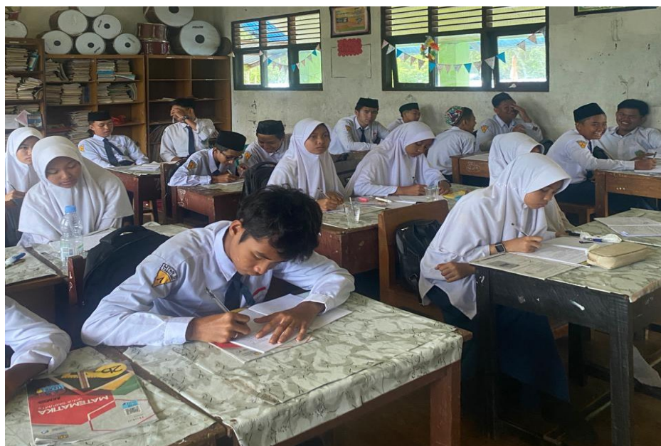
Gambar 4. 2 Pembelajaran di Kelas Eksperimen Pada Pertemuan Kedua