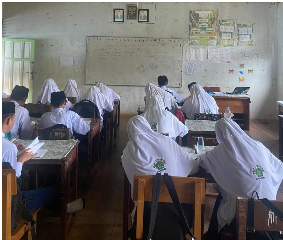
Gambar 4. 3 Pembelajaran di Kelas Eksperimen Pada Pertemuan Ketiga