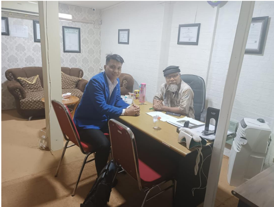
Dokumentasi dengan Ketua Koperasi Syariah Arrahamah Banjarmasin