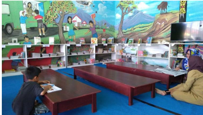
Gambar 4.5 Ruang Baca Anak

“Kurang nya motivasi dari orangtua juga menjadi faktor yang mempengaruhi minat baca generasi alpha sekarang karena sejak kecil mereka sendiri sudah diberikan gadget, tidak mengenalkan buku, tidak mengenalkan membaca nyaring, untuk anak sekarang diminta maju ke depan untuk membaca nyaring susah dan itu sering terjadi ketika saya melakukan sosialisasi.” 62