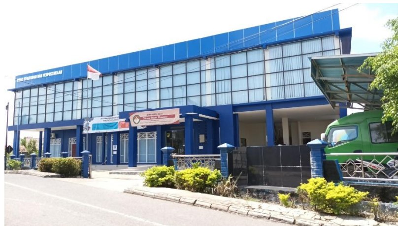
Gambar 4.1 Dinas Kearsipan dan Perpustakaan Daerah Barito Utara

target tahun ini ingin menjangkau beberapa desa yang belum sempat dikunjungi karena kondisi geografis fasilitas yang belum memadai.” 52