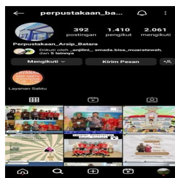
Gambar 4.2 Instagram Dinas Kearsipan dan Perpustakaan Daerah Barito Utara

Upaya promosi perpustakaan sekarang dilakukan dengan memanfaatkan media Instagram , seperti yang disampaikan oleh pustakawan pada tanggal 11 Januari 2024: