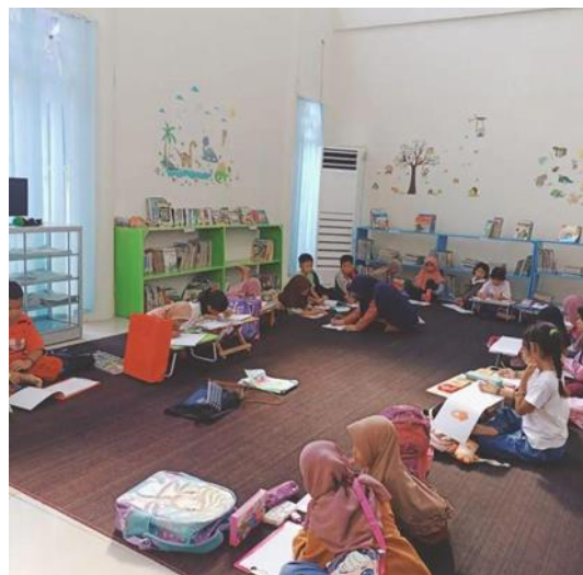
Gambar 4.3 Kegiata Belajar Di Dinas Kearsipan Dan Perpustakaan Daerah Barito Utara

Upaya lain juga dilakukan untuk menarik minat baca generasi alpha di era digital yang ada di Barito Utara khususnya di dalam kota perpustakaan membuat berbagai kegiatan di perpustakaan seperti yang di jelaskan oleh pustakawan pada tanggal 11 Januari 2024: