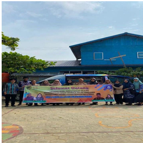
Gambar 4.6 Layanan Perpustakaan Keliling

“Keterbatasan sarana dan prasarana perpustakaan untuk mengakses beberapa desa yang ada diluar kota menjadi kendala bagi perpustakaan dalam mengembangkan minat baca, perpustakaan keliling beroperasi mendatangi sekolah-sekolah yang ada di desa untuk sekolah yang sulit untuk di jangkau oleh perpustakaan kami melakukan kerjasama dengan Dinas Pendidikan dan Dinas Sosial Pemberdayaan Masyarakat Dan Desa yang akan menghubungkan kami ke sekolah itu, kemudian juga ada kerjasama dengan Kementerian Agama, dengan adanya kerjasama ini dihapkan dapat membantu perpustakaan dalam beroperasi karena terkendala oleh sarana dan prasarana dari perpustakaan seperti mobil perpustakaan keliling yang beroperasi hanya satu mobil serta kami terkendala komunikasi mengenai bahan bacaan.” 63