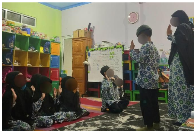
Gambar 4.9 Ustadzah menjelaskan gerakan salat yang benar (cdf9) 123

hingga salam. Ustadzah selalu mengingatkan untuk merapatkan shafnya, yaitu bahu dan mata kaki saling bersetuhan. Ketika anak-anak melakukan praktik salat, para Ustadzah membantu merapatkan shaf. Kegiatan praktik salat tidak diniatkan bersama imam tetapi sendiri-sendiri namun dilakukan bersama-sama agar para Ustadzah dapat memeriksa bacaan dan gerakan anak, tidak lupa selalu memperhatikan shaf yang tidak rata. Selesai salat, anak diajarkan untuk tidak berdiri langsung tetapi membaca dzikir setelah salat (co4.p6). 122