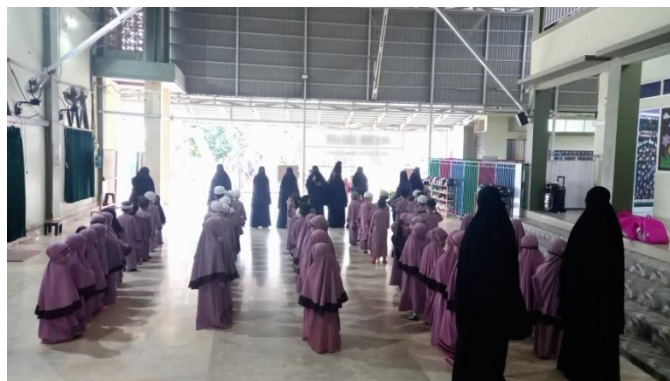
Gambar 4.3 Kegiatan klasikal pagi hari di halaman (cdf4) 101

Pada gambar 4.3, berdasarkan hasil observasi yang dilakukan oleh peneliti terkait kegiatan klasikal di halaman, peneliti akan memaparkan hasil pengamatan implementasi pendidikan tauhid di TKITQ Imam Syafi’I Banjarmasin yang dilakukan pada hari Selasa, 27 Februari 2024, sebagai berikut: