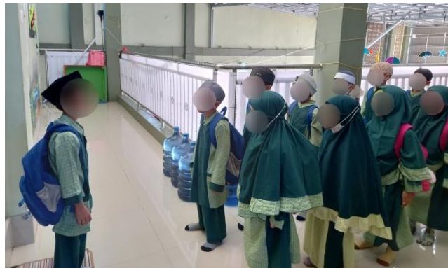
Gambar 4.4 Berbaris salam dan membaca adab masuk kelas (cdf6) 108

Pukul 08.00 anak-anak dibubarkan untuk memasuki kelas dengan tertib. Sebelum memasuki kelas anak dicek kerapian dan ketertibannya dalam mengucapkan salam dan adab masuk kelas. Yang pertama memasuki kelas adalah perempuan, barulah ketika yang laki-laknya sudah dinyatakan tertib oleh sang komando, baru mereka dipersilahkan untuk memasuki kelas (co2.p6). 107