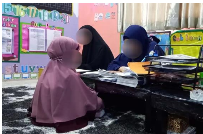
Gambar 4.12 Kegiatan setoran hafalan surah (cdf12) 127

Anak usia dini yang bersekolah di TKITQ Imam Syafi'I wajib menghafal Al-Qur'an sesuai batas kemampuan anak. Kegiatan mengaji aisar dan setoran hafalan dilakukan setelah kegiatan ziyadah tarbiyah dan bisa juga dilakukan setelah Ustadzah menjelaskan materi ke TK-an. Sembari mengerjakan tugas ke TK-an, anak-anak akan dipanggil untuk mengaji dan setoran hafalan secara bergiliran. Adapun ziyadah ayat baru atau surah baru dilakukan setiap pagi berbarengan dengan pembelajaran tarbiyah (co2.p11). 126 Ini dilakukan setiap hari kecuali hari Jum'at yang hanya dilakukan untuk muroja'ah hafalan tarbiyah selama satu pekan. Hal ini diperkuat oleh hasil pengamatan dan juga wawancara yang peneliti lakukan di sekolah.