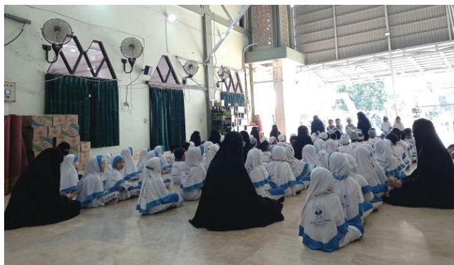
Gambar 4.5 Pembacaan dzikir pagi (cdf5) 109

anak membaca dzikir pagi dengan semangat. Terdapat lima orang anak duduk di depan bersama Ustadzah bertugas memimpin pembacaan dzikir pagi. Kelima orang anak tadi saling bergiliran memegang mic untuk memimpin pembacaan dzikir pagi. Dzikir pagi dibaca bersama-sama hingga selesai.