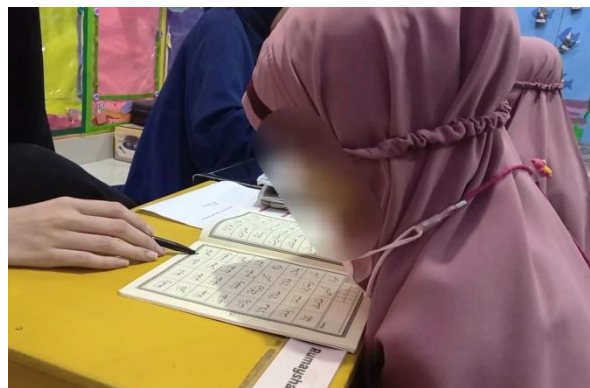
Gambar 4.11 Mengaji aisar (cdf11) 125

Dalam menumbuhkan ketauhidan anak, di TKITQ Imam Syafi'I anak-anak diajarkan cara membaca Al-Qur'an dengan metode aisar dengan dituntun oleh Ustadzah yang bertugas memeriksa bacaan anak.