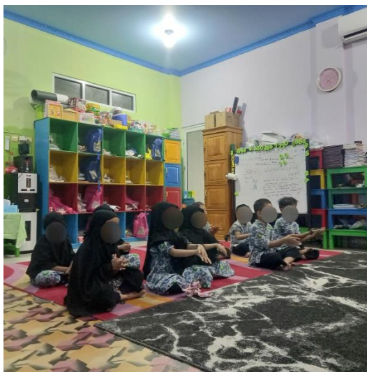
Gambar 4.8 Kegiatan Praktik wudu (cdf8) 120

Pada gambar 4.8 Ustadzah mulai menjelaskan urutan berwudu, cara wudu sekaligus memperagakannya. Dimulai dengan mengusap wajah hingga batas-batas muka. Mencuci tangan dan digosokkan hingga siku dan sunnahnya melebihi siku dimulai dari kanan lalu kiri masing-masing tiga kali. Selanjutnya Ustadzah memanggil salah satu anak ke depan untuk membantu mempraktekkan tata cara wudu. Setelah dicontohkan oleh salah satu anak dengan dibimbing Ustadzah, anak-anak memulai praktik salat (co4.p5). 121