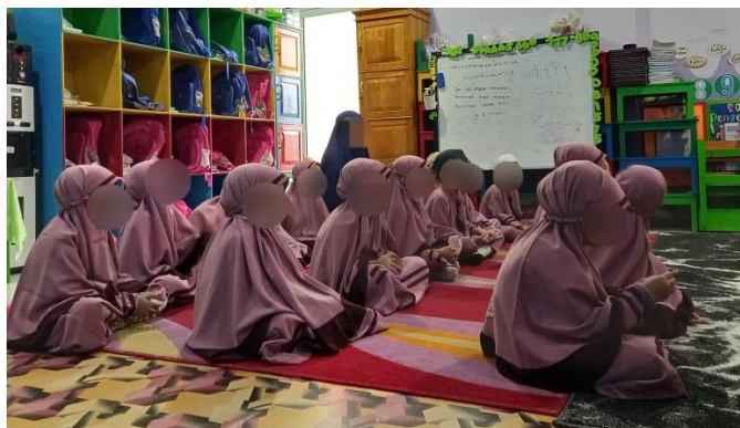
Gambar 4.13 Peserta didik duduk dengan rapi bersiap menyimak Ustadzah (cdf13) 131

Pada gambar 4.13 merupakan gambar yang menunjukkan kesiapan peserta didik dalam menuntut ilmu yaitu adab kepada Ustadzah yang akan menyampaikan pembelajaran. Terdapat materi tarbiyah tentang adab yang akan selalu dibaca berulang-ulang setiap ingin melakukan aktivitas. Seperti ketika akan memasuki kelas maka terlebih dahulu membaca adab masuk kelas, ketika jam istirahat makan anak terlebih dahulu membaca adab makan dan minum, Yaa Ghulaam, wa kul biyamiinik, wa kul mimmaa yaliik, yakuulu qoblal aqli, bismillah (Wahai anak muda! Makanlah dengan tangan kananmu, makan apa yang ada di depan, sebelum makan ucapkan bismillah) (co4.p7). 132