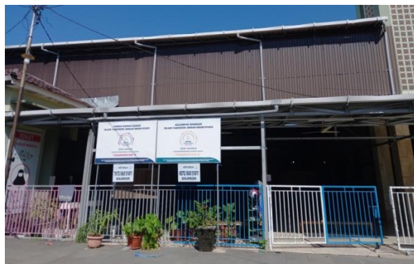
Gambar 4.1 TKITQ Imam Syafi'I Banjarmasin (cdf1) 70

kepada anaknya sesuai ajaran yang diberikan para salafus shalih (cwm10). 68 TKITQ Imam Syafi'I berdiri di bawah naungan yayasan Al-Umm pada 3 Juli 2017 dengan SK izin operasional 91200111025554 terakreditasi A (cwm3). 69