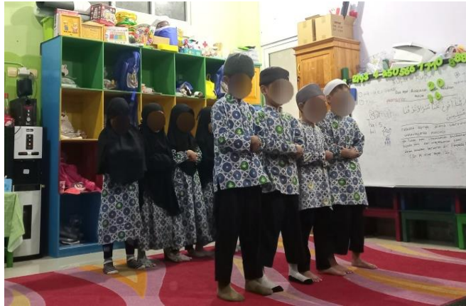
Gambar 4.10 Peserta didik melakukan praktik salat (cdf10) 124