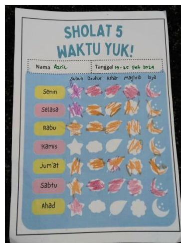
Gambar 4.7 Lembar pelaporan salat lima waktu (cdf20) 115

Pendidikan tauhid berupa pembiasaan yang diterapkan di TKITQ Imam Syafi’I Banjarmasin adalah salat. Anak tidak hanya dipantau salatnya melalui praktik di sekolah, tetapi juga kebiasaan salat anak di rumah. Di sekolah anak-anak diberikan lembar pelaporan salat lima waktu, termasuk di kelas TK B Khadijah.