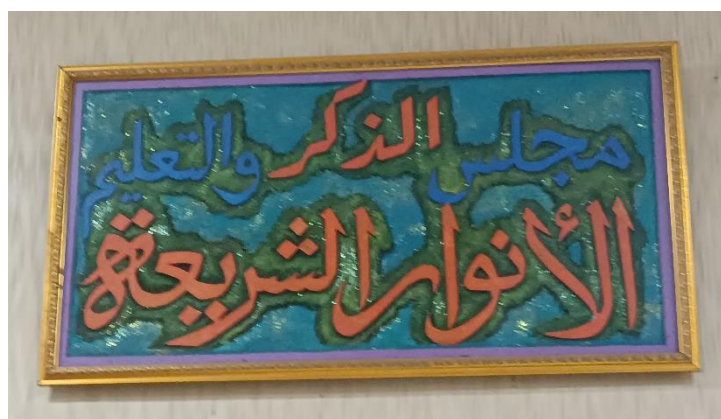
Gambar 4. 4 Kaligrafi Nama Majelis taklim Al-Anwarus Syariah.

Dan kemudian majelis taklim ini diresmikan pada bulan Agustus tahun 2018 dengan nama Al-Anwarus Syariah, dan yang memberikan nama ialah langsung dari Habib Umar bin Hafidz, dengan maksud dan harapan agar majelis taklim tersebut bisa menjadi cahaya-cahaya (penerang) bagi para jamaahnya untuk senantiasa mengenal dan mempelajari sebuah syariah-syariah atau pengajaran, amalan, dan aturan yang ada dalam agama Islam. 5