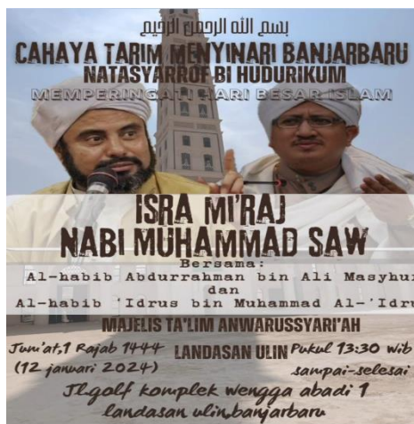
Gambar 4. 10 Pamflet Undangan Isra Mi'raj Nabi Muhammad.

nya semakin kuat dan kokoh keimanannya, dan juga semakin mencintai Rasulullah saw. 12