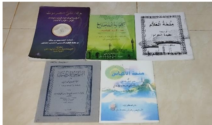
Gambar 4. 8 Kitab yang dipelajari di Majelis Al-Anwarus Syariah.

Oleh karena itu, ada banyak kitab-kitab yang dipelajari oleh jamaah dari awal majelis taklim Al-Anwarus Syariah ini berdiri, yaitu ada kitab terjemahan kitab minḥat al-'alam , terjemahan kitab minḥat al-akyâs , kitab al-Bahjat al-mardhiyyah , kitab kifayat al-muhtâj , kitab Bunga Rampai Hadramaut, dan lain sebagainya.