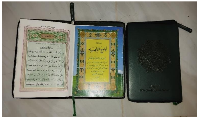
Gambar 4. 7 Kitab dan syair yang dibaca di Majelis Al-Anwarus Syariah.

Sedangkan dalam syair qasidah al-masyurah bil-barkati , dalam qasidah tersebut berisi tentang pujian-pujian dan penghormatan kepada Allah Swt, dan juga Rasulullah saw. dalam bentuk bait syair yang pendek, dan kitab dalail al-khairat berisi tentang sholawat pujian-pujian kepada Rasulullah saw, yang mana ini bermanfaat sebagai penghubung kepada Allah Swt dengan perantara sholawat untuk menunjukkan rasa cinta para pembacanya kepada Nabi Muhammad saw.