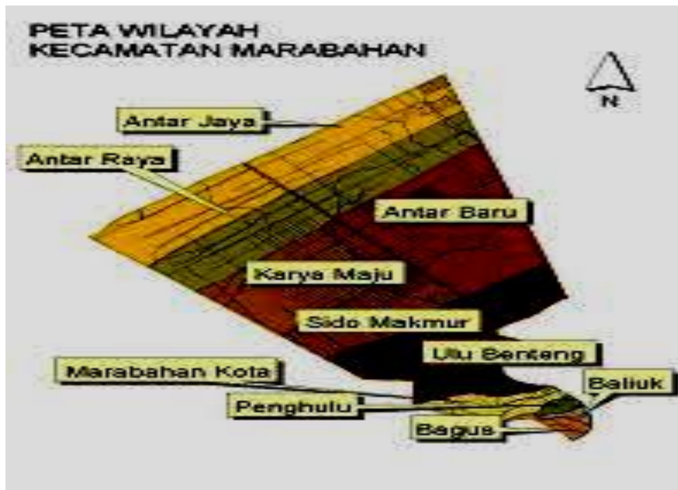
Gambar 4.1 Sketsa Wilayah Kecamatan Marabahan