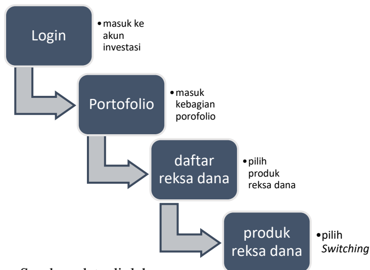
Gambar 4. 5 Alur Switching produk di Bibit