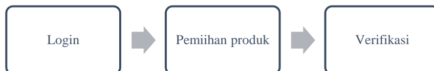
Gambar 4. 4 Alur penjualan kembali produk Reksa Dana

PT Bibit Tumbuh Bersama pada aplikasi Bibit mempermudah proses penjualan atau redemption Unit Penyertaan, baik untuk Reksa Dana syariah maupun konvensional, tanpa ada perbedaan khusus dalam cara penjualannya. Penjualan dapat dilakukan setelah produk Reksa Dana yang dibeli diverifikasi oleh manajer investasi dan dinyatakan berhasil diproses. Investor dapat melakukan penjualan langsung melalui aplikasi Bibit. Untuk mengetahui langkah-langkah penjualan ( redemption ), investor dapat mengunjungi website resmi Bibit dan mengikuti panduan yang tersedia di sana: