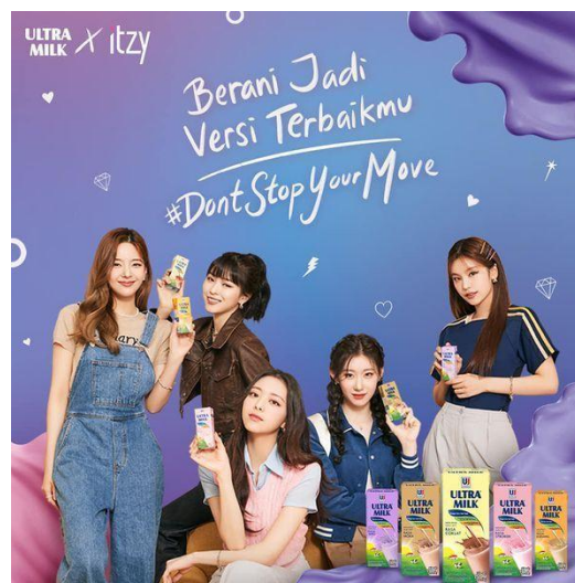
Gambar 1.2 Poster ITZY Ultra Milk

Dengan adanya fenomena Korean Wave yang hadir di Indonesia, banyak merek lokal Indonesia yang menggunakan artis Korea Selatan untuk dijadikan sebagai Duta Merek ( Brand Ambassador ) produknya. Salah satu diantaranya yaitu Ultra Milk yang bekerja sama dengan ITZY dan Stray Kids.