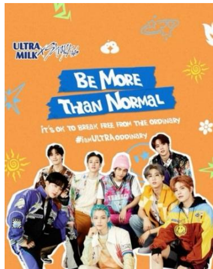
Gambar 1.3 Poster Stray Kids Ultra Milk