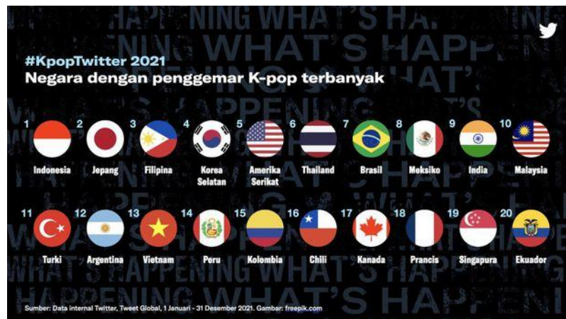
Gambar 1.1 Peringkat Negara Dengan Penggemar K-Pop Terbanyak