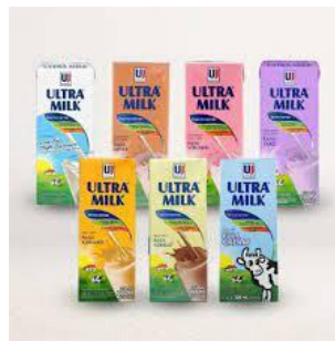
Gambar 1.4 Susu Ultra Milk

Selain itu, Ultra Milk juga menjadi salah satu produk susu UHT yang paling diminati oleh konsumen. Dengan beberapa varian rasa yang mereka sediakan seperti full cream, coklat, stroberi, mocca, karamel, dan taro. Adapun varian low fat high calcium yang juga disediakan dalam 2 rasa yaitu plain dan coklat.