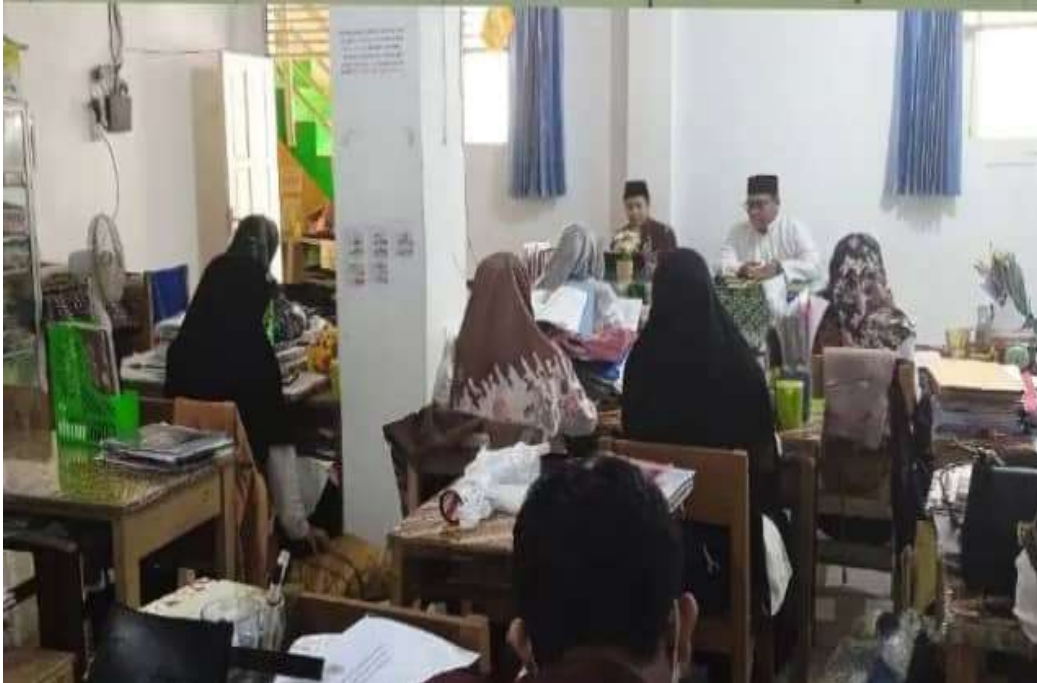
Rapat bulanan dengan guru dan wali siswa