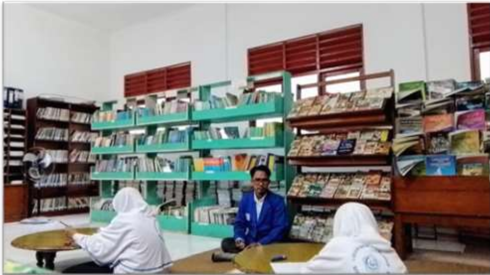
Gambar 4.9 Pelaksanaan Tahap One-to-one

Tahap one-to-one ini dilakukan pada tanggal 2 Februari 2024 di MTsN 2 Kota Banjarmasin. Pada tahap ini prototype 1 diujicobakan kepada 2 orang siswa dengan kemampuan yang rendah dan tinggi berdasarkan pilihan guru. Tujuan dari tahap ini adalah menilai keterbacaan soal prototype I berdasarkan pandangan siswa seperti apakah siswa memahami soal/instruksi soal atau apakah ada kata yang ambigu dan gambar/diagram yang kurang jelas. Dokumentasi tahap one-to-one dapat dilihat pada gambar 4.9 pelaksanaan tahap one-to-one