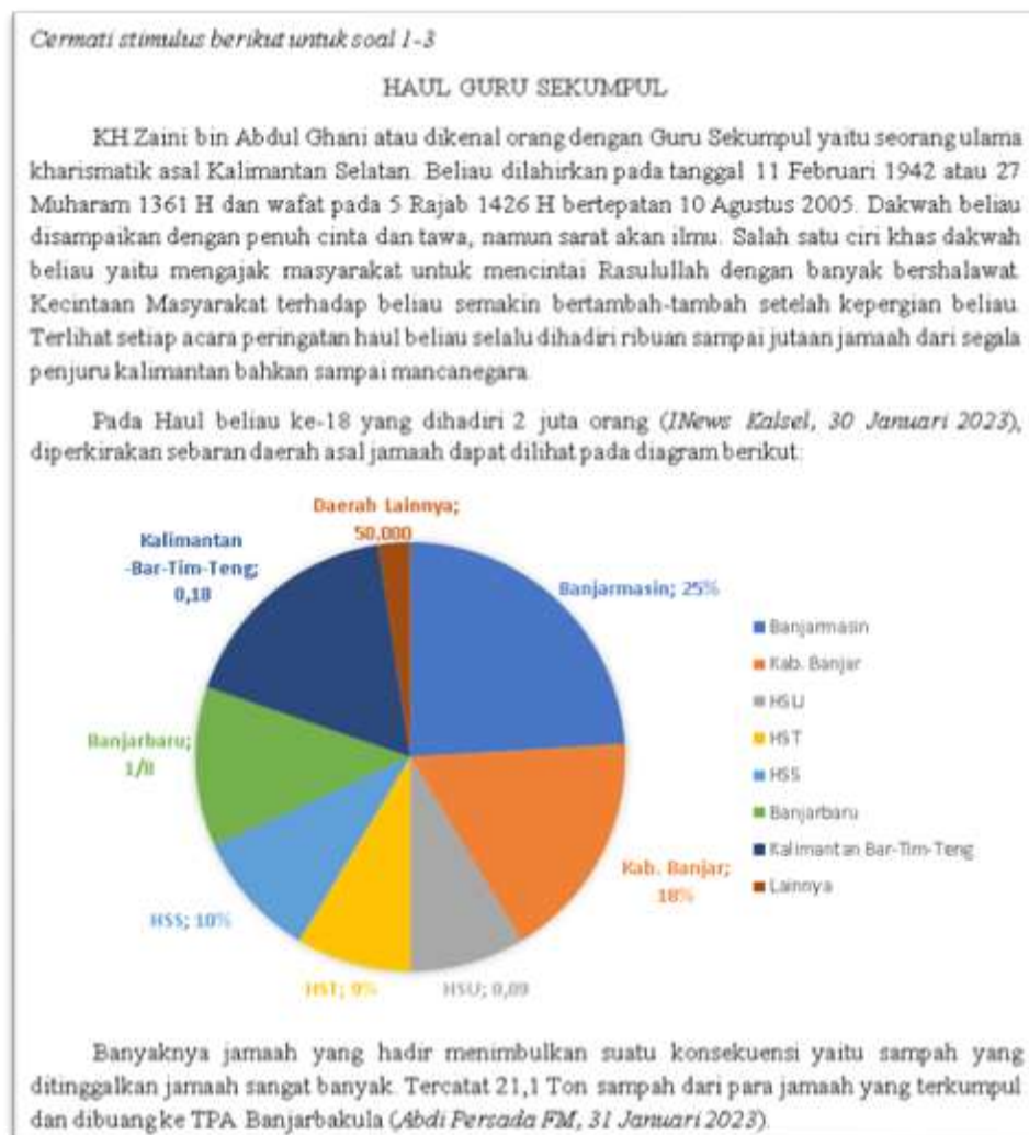
Gambar 4.2 Stimulus 1 Sesudah Direvisi

Perbaikan stimulus 1 dapat dilihat pada gambar 4.2 stimulus 1 sesudah direvisi.