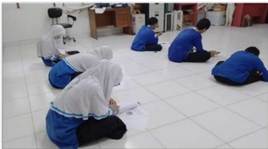
Gambar 4.10 Pelaksanaan Tahap Small Group

Hasil revisi dari tahap expert review dan one-to-one atau disebut prototype II akan diujikan kembali kepada 6 orang siswa dengan kemampuan beragam (rendah, sedang, dan tinggi) untuk mengukur kepraktisan soal. Tahap small group ini dilakukan pada tanggal 20 Februari 2024 di MTsN 2 Kota Banjarmasin. Dokumentasi tahap small group dapat dilihat pada gambar 4.10 pelaksanaan tahap small group