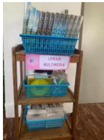
Dokumentasi rak majalah dan koran, rak koleksi audio visual.