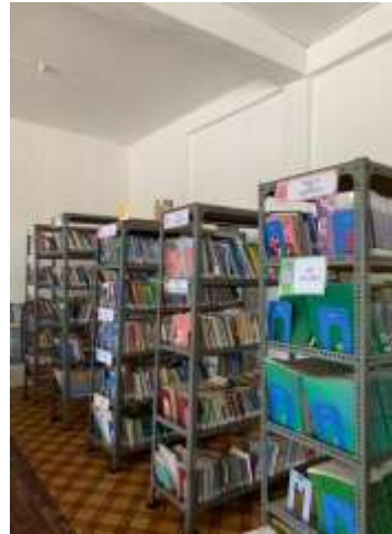
Dokumentasi rak buku ruang sirkulasi koleksi Teksbooks , dan rak buku ruang sirkulasi koleksi umum dan fiksi.