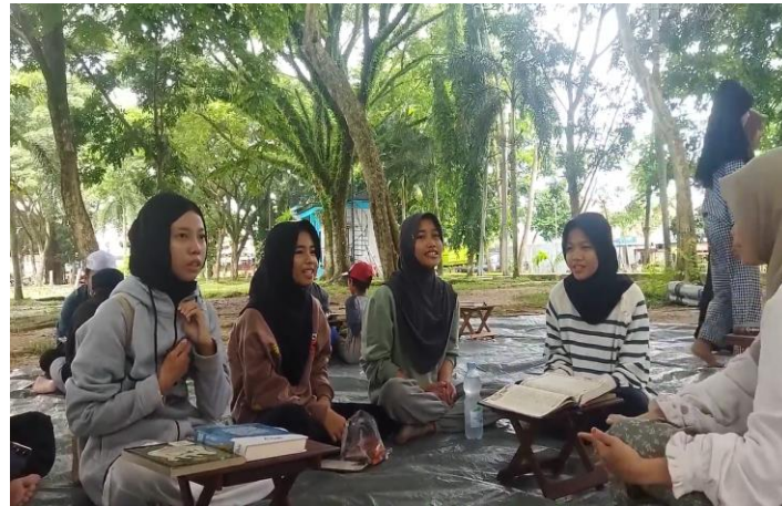
Gambar 4.6 Kegiatan Murojaah Bareng

kegiatan yang menyenangkan juga dapat membantu peserta untuk lebih mudah memahami dan mengingat materi yang diajarkan. Dengan begitu, tujuan dakwah dapat tercapai lebih efektif karena peserta merasa terlibat dan menikmati proses belajarnya.