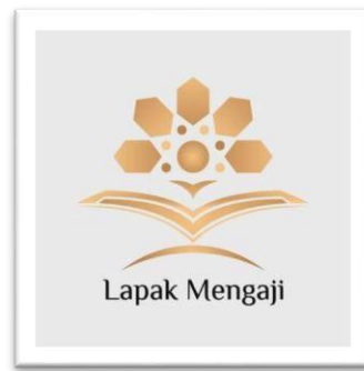
Gambar 4.3 Logo Timsus Lapak Mengaji