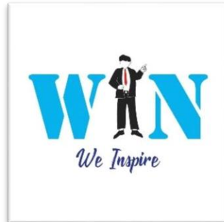
Gambar 4.1 Logo We Inspire Indonesia

Logo We Inspire Indonesia bertuliskan WIN singkatan dari nama organisasi/komunitas itu sendiri. Huruf “I” di logo digantikan dengan animasi orang yang sedang orasi, dimaksudkan dengan sebuah harapan agar seluruh anggota We Inspire memiliki kemampuan berbicara yang baik di depan umum.