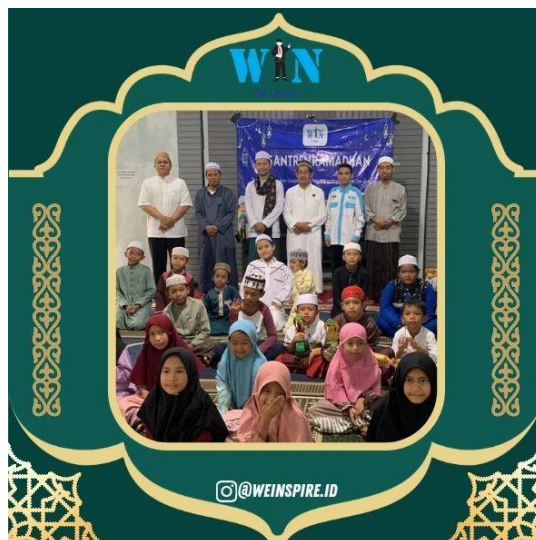
Gambar 4.12 Dokumentasi Pesantren Ramadhan Tahun Ke- 3