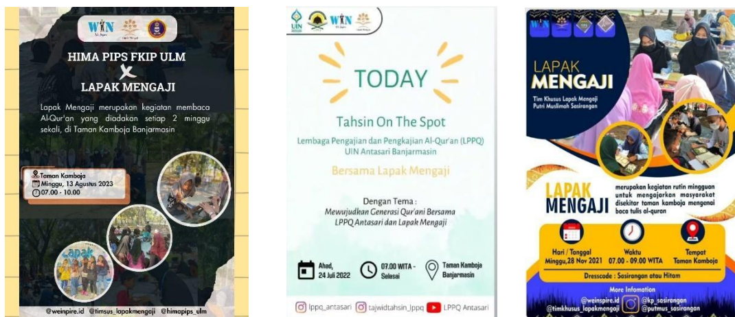
Gambar 4.13 Pamflet Kegiatan Kolaborasi dengan Berbagai Organisasi

Berdasarkan observasi dan penelitian, penulis menemukan bahwa sudah banyak komunitas dan organisasi yang pernah bekerja sama dengan We Inspire dan Timsus Lapak Mengaji, antara lain LPPQ UIN Antasari, Putri Muslimah Sasirangan, Banua Cendekia, Forum Anak Banjarmasin, HIMA PIPS FKIP ULM, GENBI UIN, dan lain sebagainya.