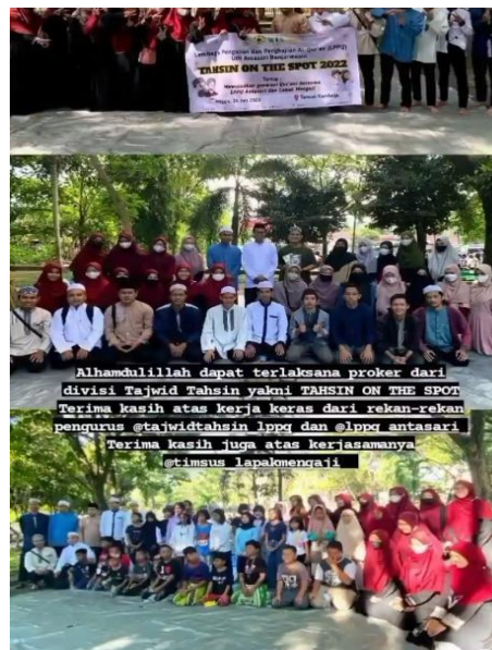
Gambar 4.14 Dokumentasi Kegiatan Kolaborasi dengan LPPQ UIN Antasari