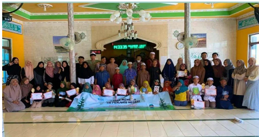
Gambar 4.9 Dokumentasi Kegiatan Lapak Mengaji Ke Penjuru Negeri di Desa Karang Buah, Kab. Banjar