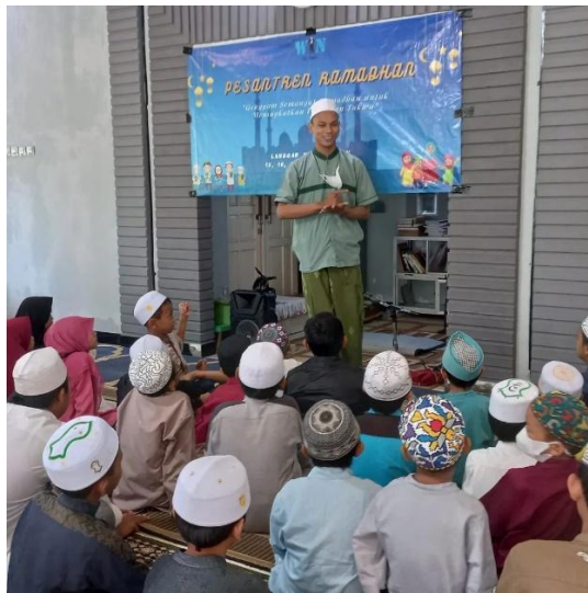
Gambar 4.11 Dokumentasi Pesantren Ramadhan Tahun Ke- 2