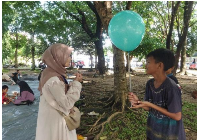
Gambar 4.5 Pemberian Hadiah Karena Telah Mengikuti Kegiatan

Menurut penulis, pemberian hadiah merupakan strategi yang sangat tepat digunakan untuk menarik minat peserta terutama anak-anak. Hal ini dilakukan karena dapat meningkatkan motivasi dan minat peserta. Dengan memberikan hadiah, peserta merasa dihargai dan lebih termotivasi untuk ikut serta dalam kegiatan Lapak Mengaji. Selain itu, hadiah juga bisa menjadi daya tarik bagi peserta baru yang mungkin awalnya ragu untuk bergabung. Hadiah tidak hanya berfungsi sebagai apresiasi tetapi juga sebagai alat persuasif yang efektif untuk meningkatkan partisipasi dan keterlibatan dalam kegiatan.