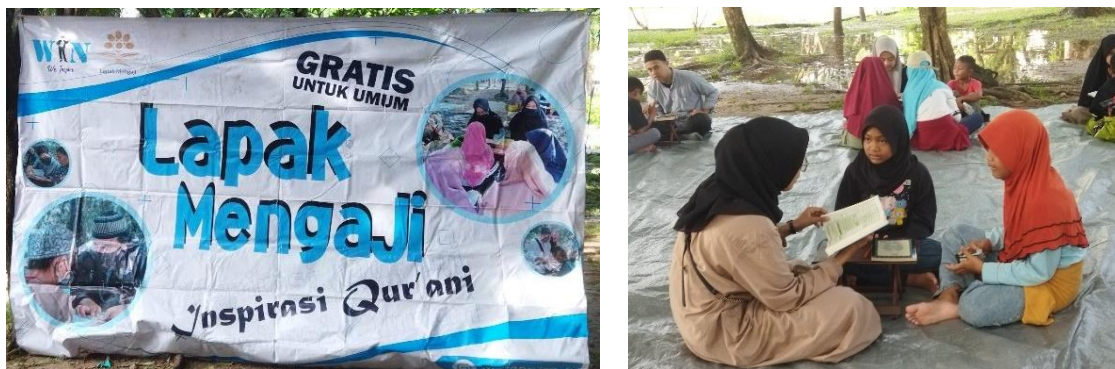
Gambar 4.2 Aktivitas Lapak Mengaji di Taman Kamboja

Berdasarkan observasi dan hasil penelitian penulis, Timsus Lapak Mengaji ini masih rutin melakukan pengajaran Alquran dan terlihat antusias pengunjung untuk mengikuti kegiatannya, dari anak-anak, remaja, hingga orang dewasa.