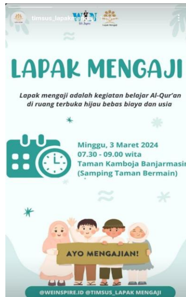
Gambar 4.16 Pamflet Promosi Kegiatan Melalui Story Instagram Timsus Lapak Mengaji