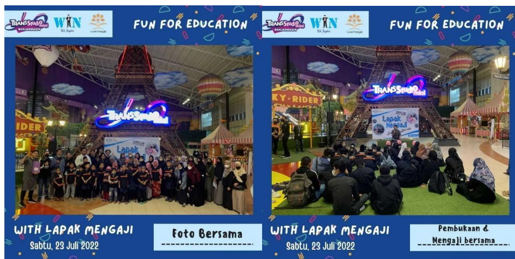
Gambar 4.7 Kegiatan Fun For Education di Trans Studio Mini Duta Mall Banjarmasin

Fun For Education merupakan kegiatan belajar Alquran sambil bermain yang diadakan oleh We Inspire di luar dari taman Kamboja, yakni di Trans Studio Mini Duta Mall Banjarmasin. Kegiatan ini menerapkan belajar sambil bermain dengan tujuan ingin menciptakan konsep belajar yang menyenangkan dan memberikan suasana yang berbeda dengan biasanya. Adanya kegiatan ini menunjukkan bahwasanya kita bisa belajar dimana saja bahkan dalam keadaan bermain. Peserta yang tergabung dalam kegiatan ini adalah anak-anak dari panti asuhan.