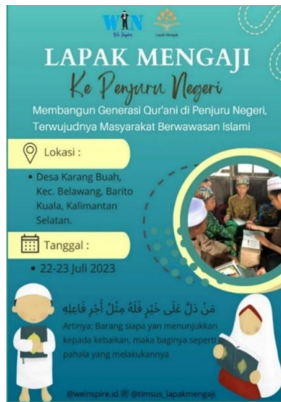
Gambar 4.8 Pamflet Kegiatan Lapak Mengaji Ke Penjuru Negeri