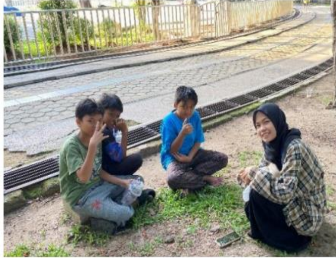
Gambar 4.4 Pendekatan dengan Pengunjung Sekitar