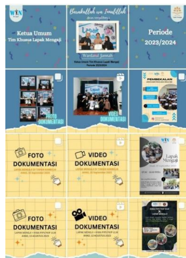
Gambar 4.17 Dokumentasi Kegiatan di Feed Instagram Timsus Lapak Mengaji