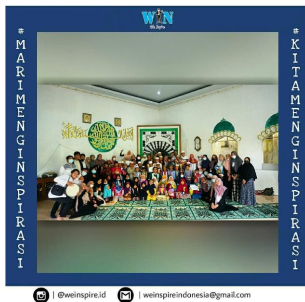
Gambar 4.10 Dokumentasi Kegiatan Pesantren Ramadhan Tahun Ke- 1

Kegiatan ini dilaksanakan karena tidak semua tempat belajar Alquran mengadakan kegiatan yang bertujuan untuk menyambut bulan Ramadhan. Kegiatan ini berisi materi seputar keislaman, dan games-games islami yang diadakan di Masjid pada bulan Ramadhan. Kegiatan ini diharapkan dapat memberi manfaat dan keberkahan pada bulan Ramadhan kepada semua pihak yang terlibat.