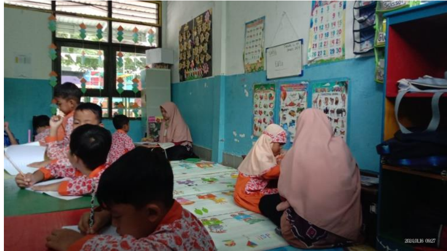
Gambar 4.2 Suasana Kelas Saat Pembelajaran (CD3.1) 66

Ustadzah M menjaga setoran hafalan surah, sedangkan Ustadzah H mengajari anak membaca dan mengeja, anak-anak yang belum dipanggil menunggu sambil menulis di buku tulis kata yang ada di papan tulis yaitu “ EARTH ”, jika anak sudah selesai menulis maka dikumpulkan ke Ustadzah. Jika waktu sudah hampir habis Ustadzah akan mengatakan “ Have you finished? ” dan jika waktu sudah habis Ustadzah akan mengatakan “ Time is up! ” anak pun cepat cepat menyelesaikan tugas mereka dan semua langsung mengumpulkan buku mereka pada Ustadzah. (CO1.P1) 67