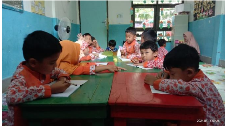
Gambar 4.3 Peserta Didik Menulis Tulisan EARTH (CD3.2) 68

Pukul 10.00 mereka bersiap-siap ingin cuci tangan, minum, dan makan snack , sebelum itu mereka mengikuti perintah Ustadzah untuk melakukan pembiasaan yang mereka lakukan setiap hari yaitu sikap berdoa.