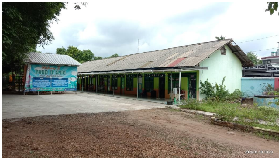
Gambar 4.1 Gedung PAUD IT ANIC Banjarbaru (CD1.1) 61

Berikut ini gambar lokasi penelitian yang peneliti sajikan.