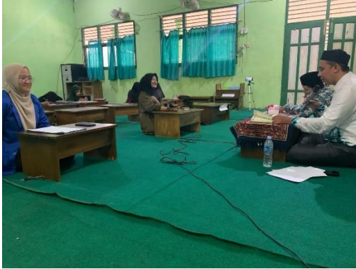
Foto Tes dan Wawancara Bersama Santri, 20 Februari 2024