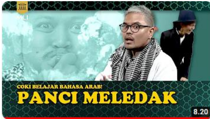
الصورة ٤.١٢ Barang Sehar-hari