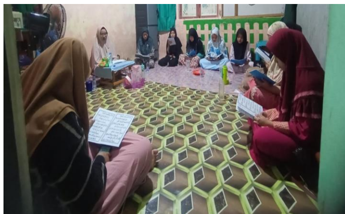
Gambar 4.5 Pembacaan Burdah

“Setiap hari memang diadakan kegiatan keagamaan, nah itu ada jadwalnya tersendiri sudah biasanya untuk kegiatannya tu kena didampingi ibu pengasuh. Untuk jadwalnya biasanya ibu mengasuhnya yang meatur jadwalnya nih, karena ibadah sangat penting untuk ditamankan mulai halus, agar buhan anak nih terbiasa kena amun sudah ganal. Untuk kegiatan mengajian dan burdah biasanya ada didatangkan gurunya tersendiri nah untuk mengaji biasanya lawan bapa Rasyid dan burdah lawan ibu nor zatil” 14