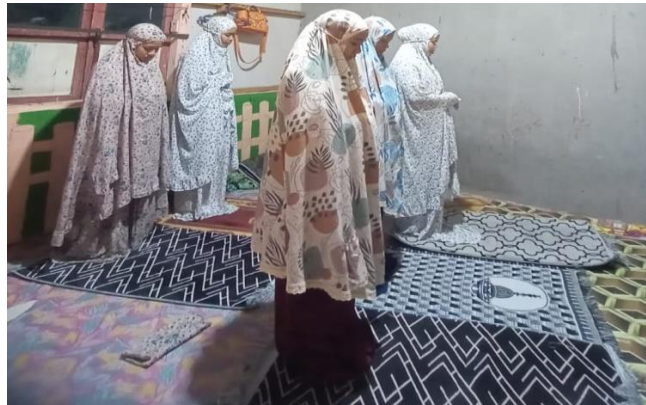
Gambar 4.2 Pelaksanaan Sholat Berjamaah

mengembangkan nilai aqidah di yayasan ini melalui kegiatan keagamaan seperti Shalat berjamaah, tadarus al-qur'an, dan yasinan. 9