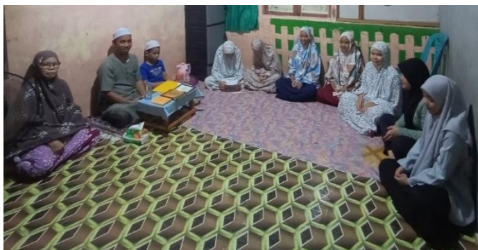
Gambar 4.4 Tadarus Al-Qur'an sekaligus pembelajaran Tajwid

“Untuk ibadah di panti ini dilakukan setiap hari misalnya kaya sholat berjam’ah untuk yang jadi imam biasanya begantian tiap kamarnya nah jadi tiap anak kena pasti dapat haji gilirannya. habis tuntung sholat berjamaah biasanya bewirid dahulu sholat sunah hanyar kena bekegiatan, tiap harinya biasanya kegitannya beda-beda sesuai lawan jadwalnya. Misalnya ada yang jadwalnya membaca Q.S yasin, Q.S Al-waqiah, Q.S Al-mulk, tadarusan, pembelajaran tajwid, burdah, membaca rawi dan maulid habsyi. Saat pembelajaran tajwid biasa dan burdah itu ada didatangkan gurunya gasan melajari buhan kakanakannya. Terkadang ada juga anak yang mengerjakan puasa sunah ” 13