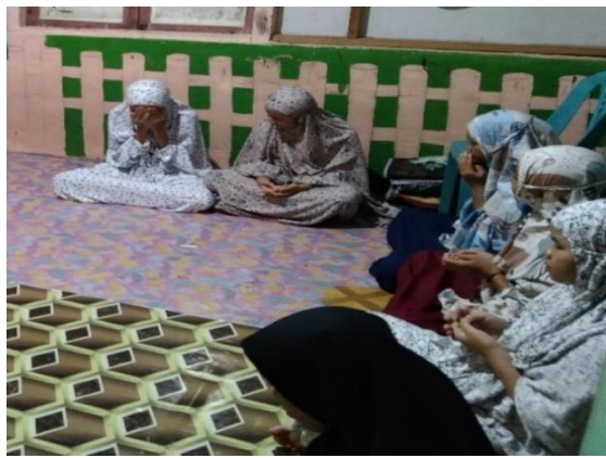
Gambar 4.3 Do'a bersama setiap selesai pelaksanaan kegiatan

“Biasanya ibu memadahi misalnya kaya sholat jangan lupa di mana pun kita berada digawi walaupun kada disuruh. Habis sholat berdo'a minta apa yang dihandaki pasti dikabulkan.” 11