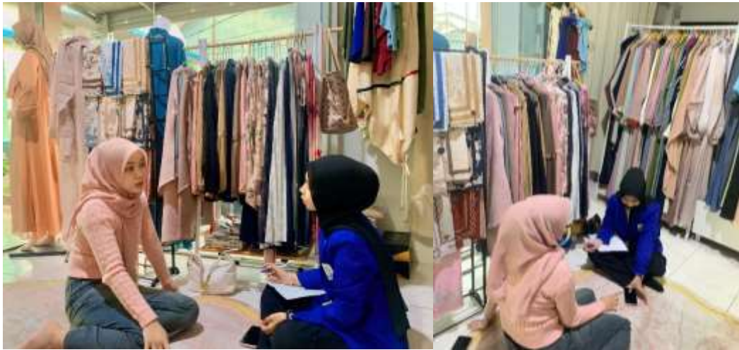
Foto Bersama Pemilik dan Pelanggan Toko Tumblrstuff Banjarmasin